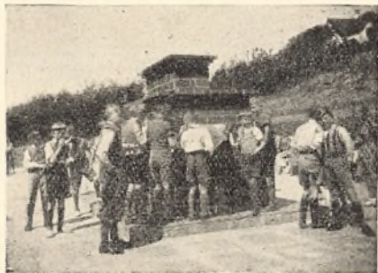
Elever i Skolegaarden

Skolepengene vil saa vidt muligt ikke blive forhøjede paa Grund af de vanskelige Tider. Kun hvis det bliver meget nødvendigt, vil en Forhøjelse finde Sted. Da denne i saa Fald vil ske i Skoleaaret, vil Meddelelse derom i god Tid blive tilstillet Forældrekredsen.