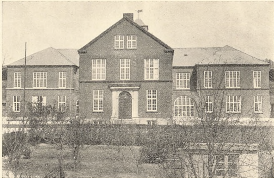
Skolen set fra Vejen