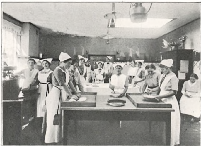
LÆRERINDEELEVER OG DERES ELEVER 1913