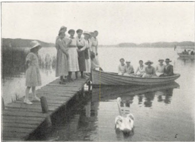
PAA SORØ SØ