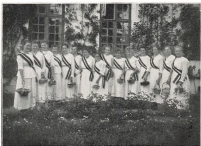
SØNDERJYDSKE ELEVER VALDEMARS DAGEN 1919