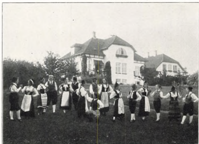
DANSEN TRÆDES 1912