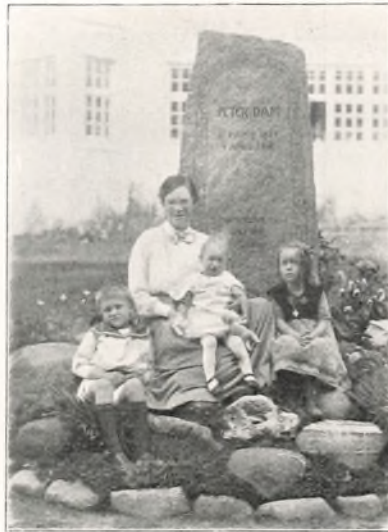
BØRNEBØRN VED MINDESTENEN