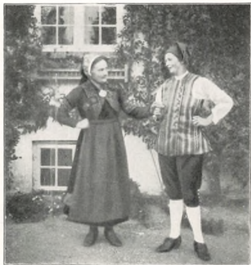
TO GODE HJÆLPERE