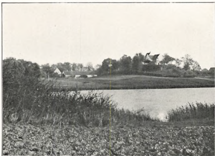
PEDERSBORG KIRKE SET FRA HAVEN FRA BÆKKEBÆNKEN