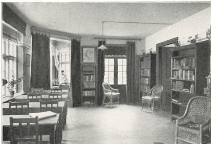
LÆSESTUEN I PETER DAMS BIBLIOTHEK