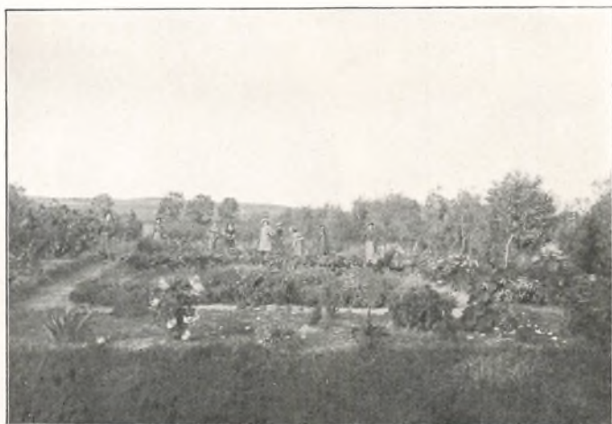
SKOLEHAVEN MED 8 SMAAPIGER I ARBEJDE