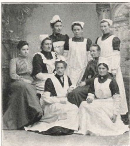
DE FØRSTE VANDRELÆRERINDER