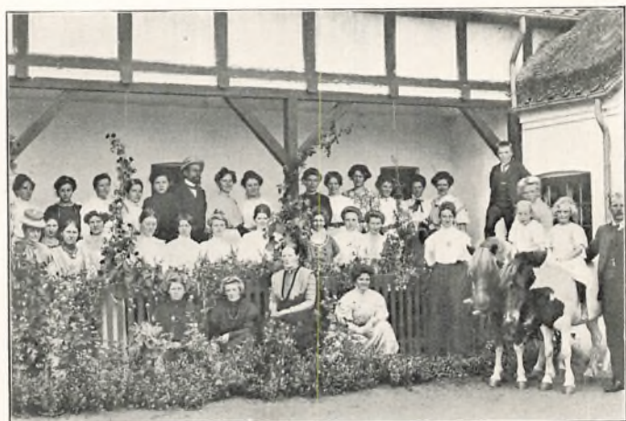
FRA GAARDENS SOMMERKURSUS 1909