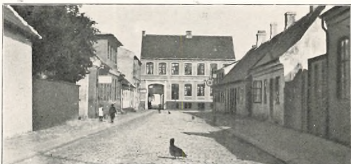
HUSHOLDNINGSSKOLENS FØRSTE HJEM 1895