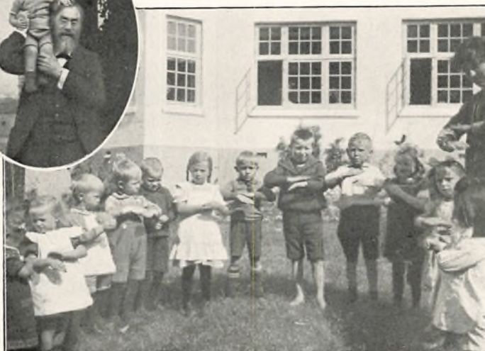
FRA BØRNEHAVEN „VEJRMØLLEN SKAL HA' VIND, VIND —“