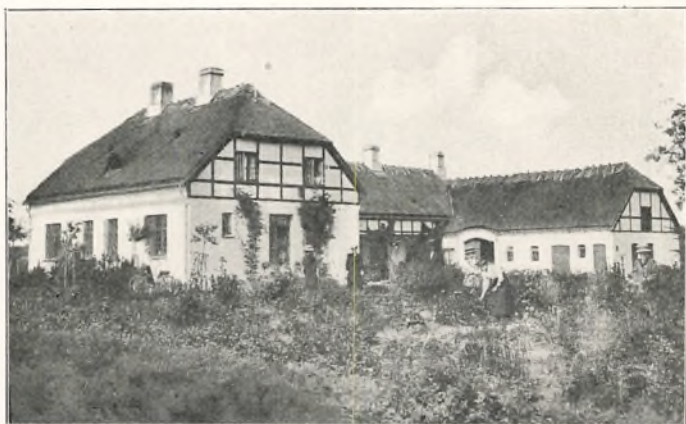
LANDBRUGSAFDELINGEN, BYGGET 1907