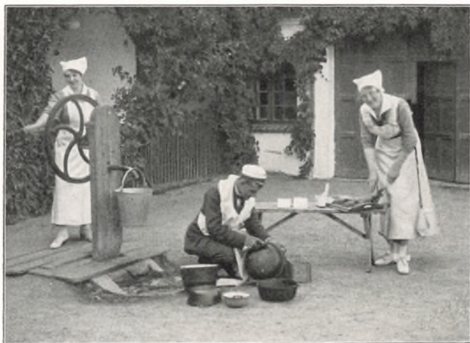
FRA FERIEEN 1917