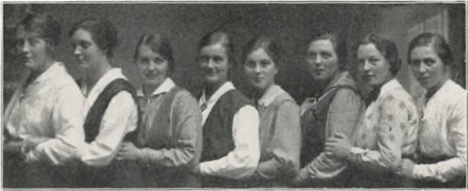
„SER I HVEM DER KOMMER HER“