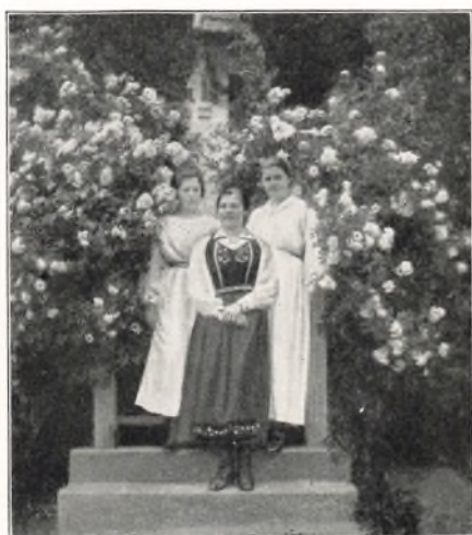
TRE NORSKE JENTER