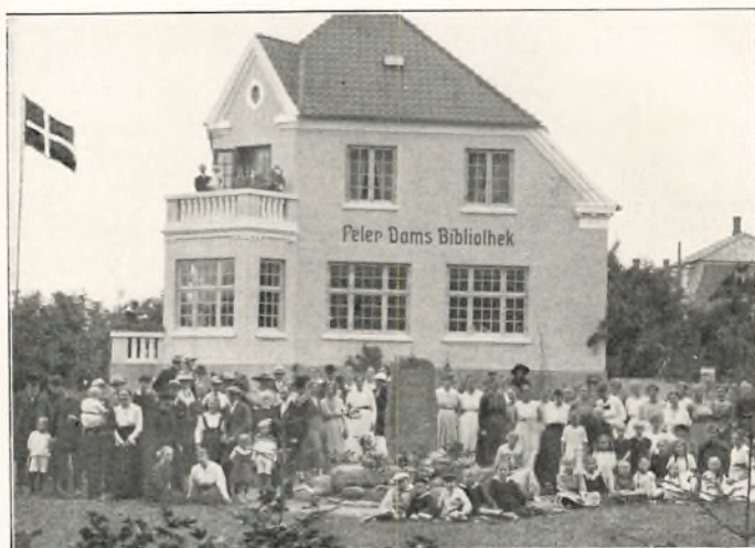
FRA MINDEFESTEN FOR FORSTANDER DAM