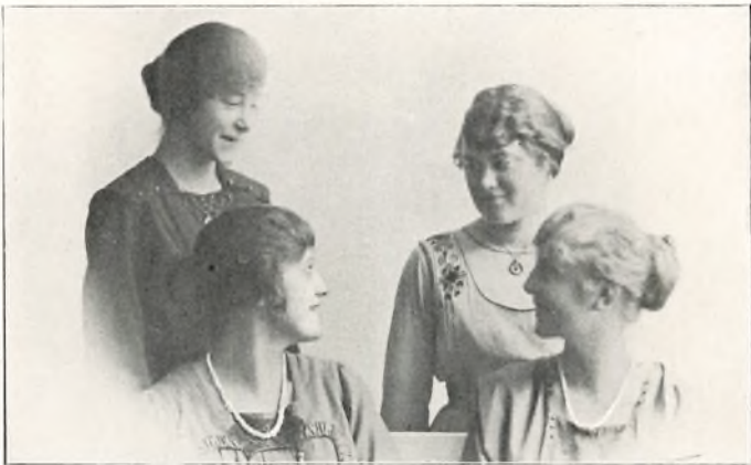
RINGSTEDPIGER FRA ØVELSESSKOLEN