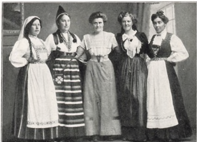
LÆRERINDEELEVER 1911 repræsenterende Finland, Sverrig, Danmark, Island, Norge.