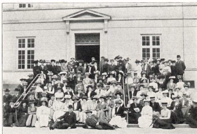
DET NORDISKE HUSHOLDNINGSMØDE AFHOLDT PAA SORØ AKADEMI 1909