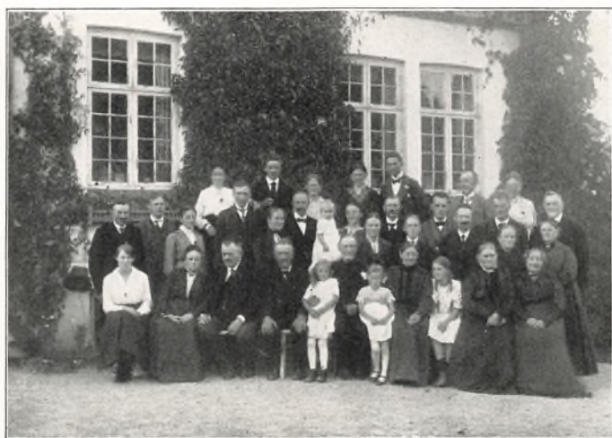
GÆSTER VED BEDSTEFADERS 75-AARIGE FØDELS DAG 1918 8 SØDSKENDE — 8 BØRN