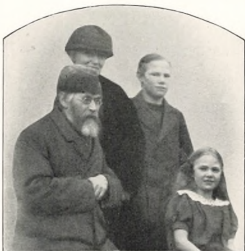
SIDSTE BILLEDE AF FORSTANDER DAM