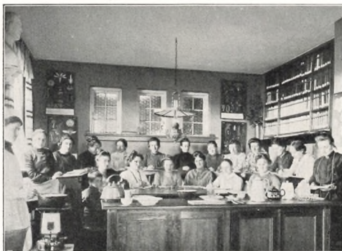
FOREVISNING I SKOLESTUEN 1905