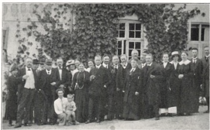
UNGDOMSSKOLEFORENINGENS AARSMØDE 1917