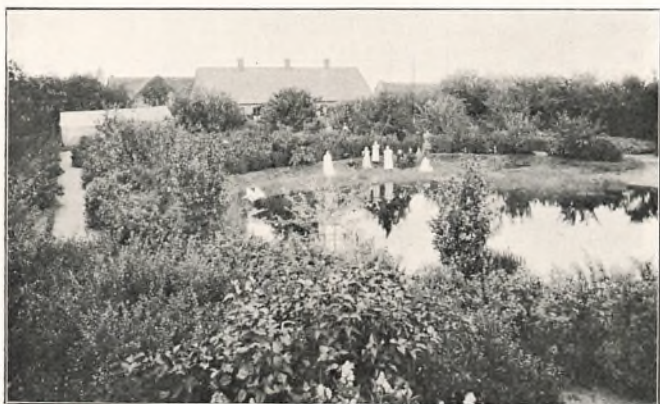
BARNDOMS- OG UNGDOMSHJEM I ASTRUP