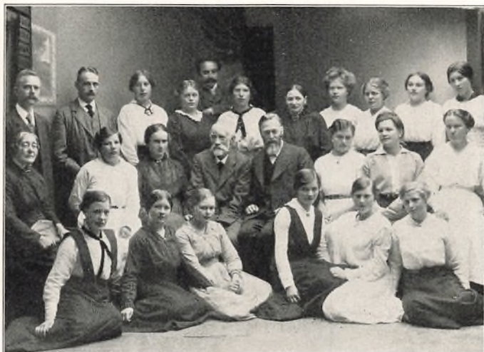
FORSKOLESEMINARIETS ELEVER OG HJÆLPERE