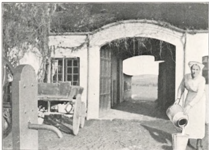
FRK. TORPEGAARD EFTER MÆLK PAA GAARDEN