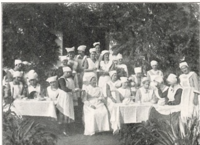
EN EKSTRA KOP KAFFE PAA GAARDEN