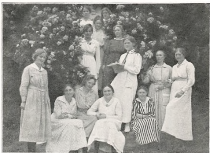
STATSDAMER = STADSPIGER