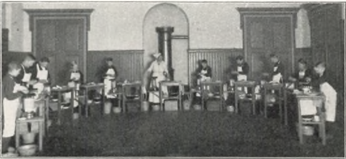
DRENGE FRA AKADEMIET OG BORGERSKOLEN UNDERVISES AF FRK. P.