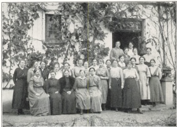
FRA ET OKTOBERKURSUS