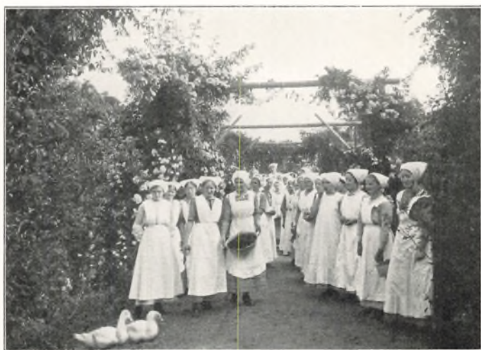
MORSENTUR I ROSENGANGEN 1916