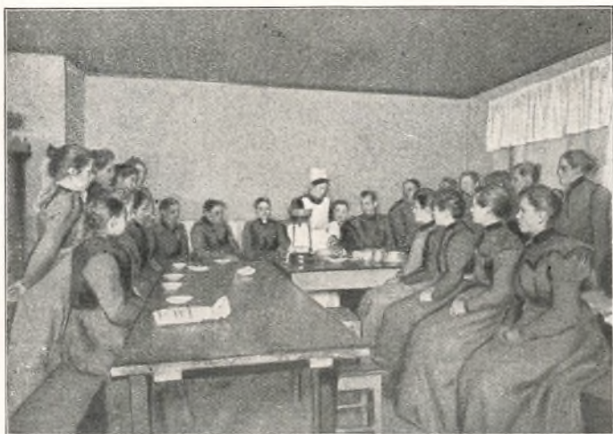
EN AF DE FØRSTE HUSHOLDNINGS-AFTENSKOLER, LANDSGRAV