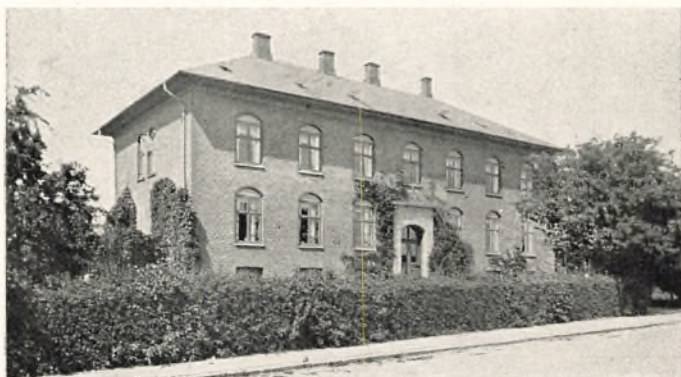
SORØ HUSHOLDNINGSSKOLE, BYGGET 1897