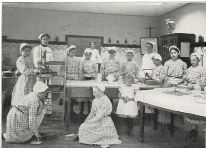
SKOLEKØKKENET MED 10 SMAAPIGER FRA LANDSOGNET 1906