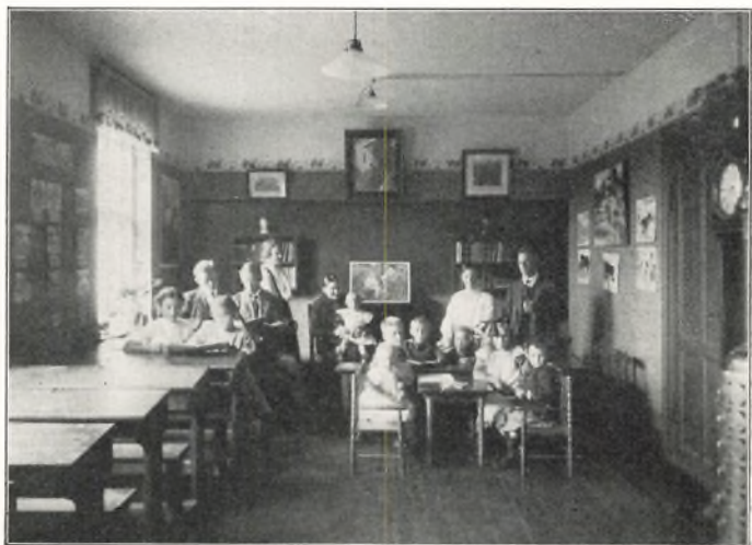
BØRNEHAVEN OG BØRNEENS LÆSESTUE