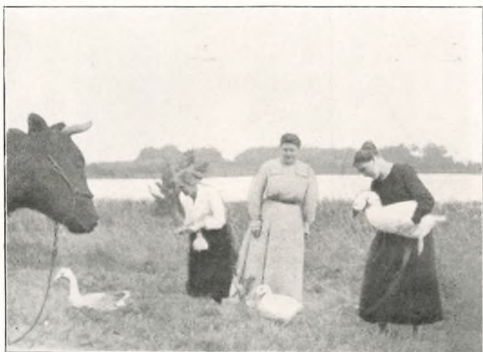
IDYL PAA „TREKANTEN“