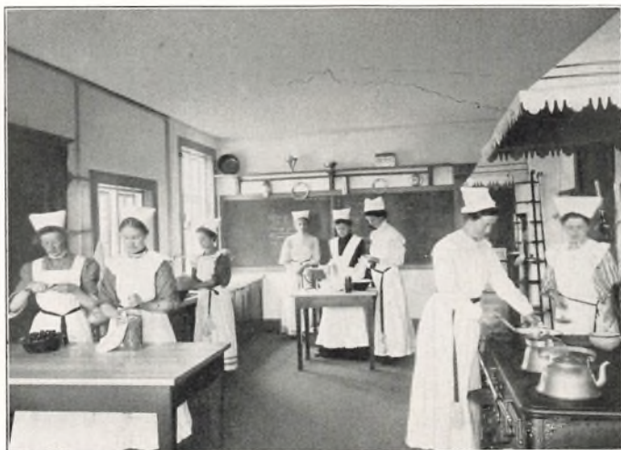
GAARDENS KØKKEN 1909