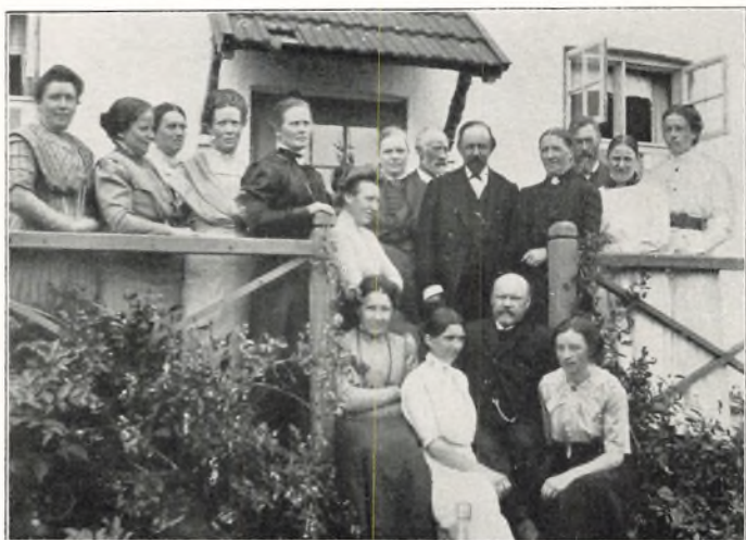
FERIEKURSUS FOR LÆRERE OG LÆRERINDER 1912