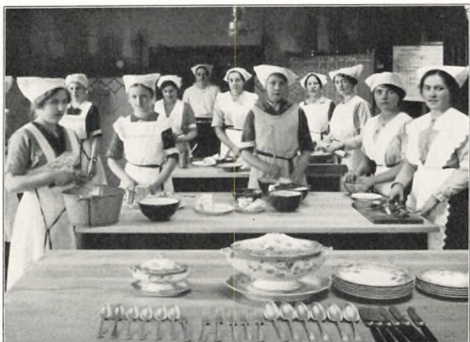
FRA UNGDOMSSKOLENS FØRSTE AAR 1914