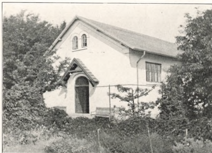
GYMNASTIKSALEN, BYGGET 1916