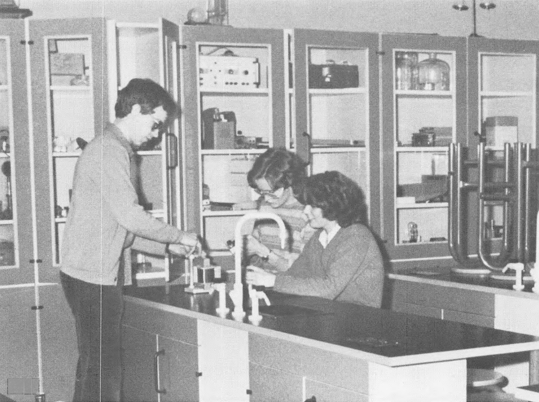
Undervisning i de nye lokaler.