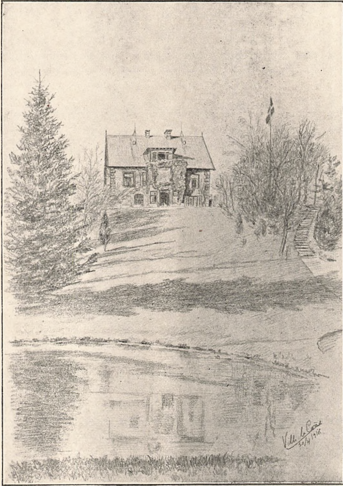
Skolehjemmet set fra Haven.