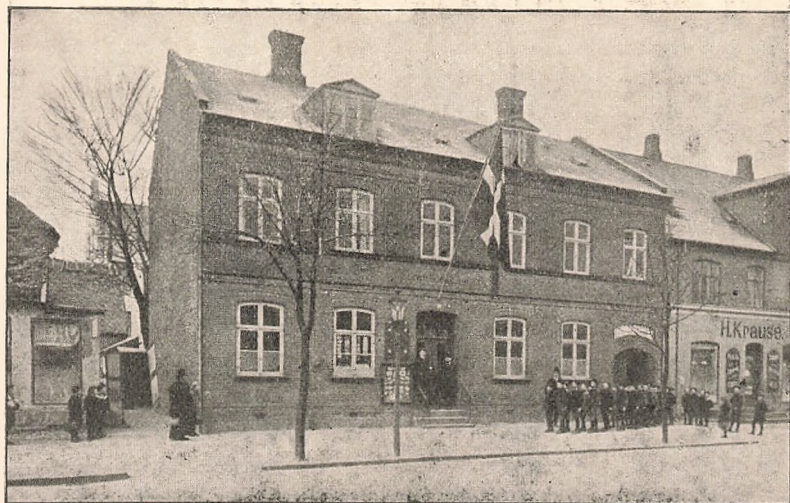
„Det røde Hus.“