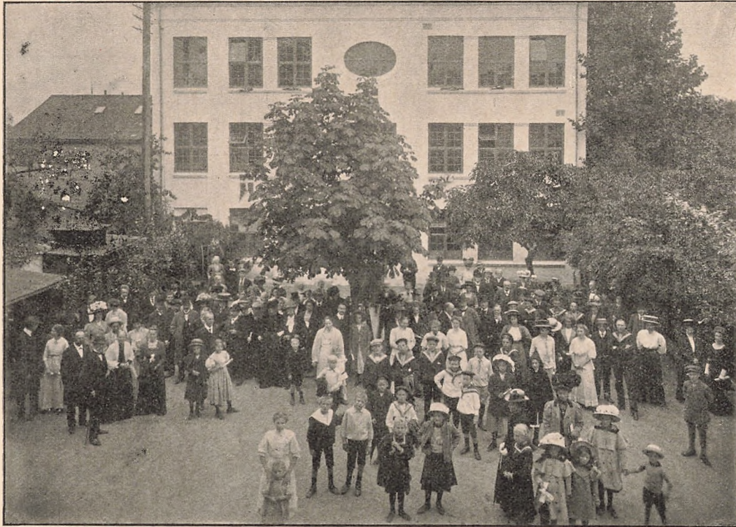
Fest i Skolegården.