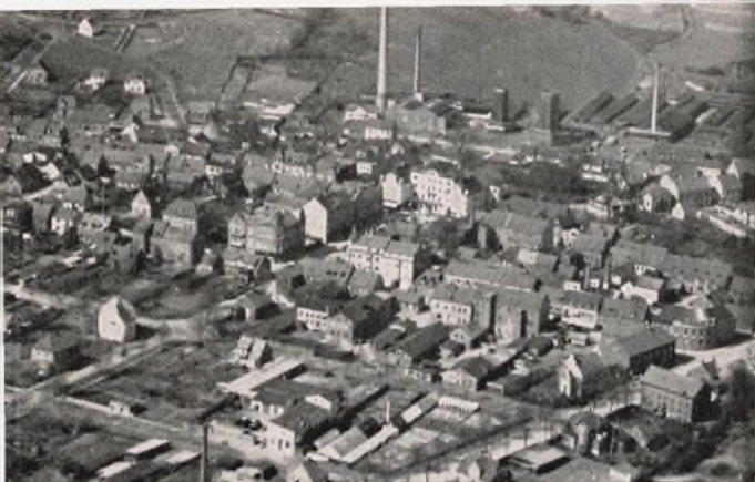
Luftfotografi af Odder By