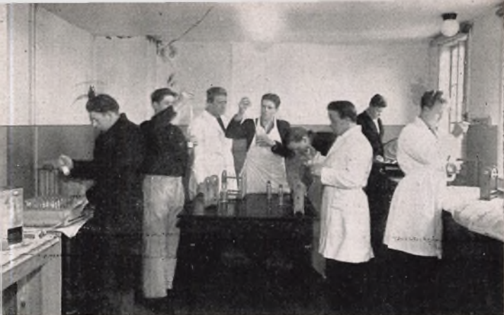
Øvelse i Gerberering

I Planteavl gennemgaas de forskellige Kulturplanter, deres Slægtskabsforhold og Forædling, Sorter og Stammer, Sygdoms-angreb og disses Bekæmpelse.