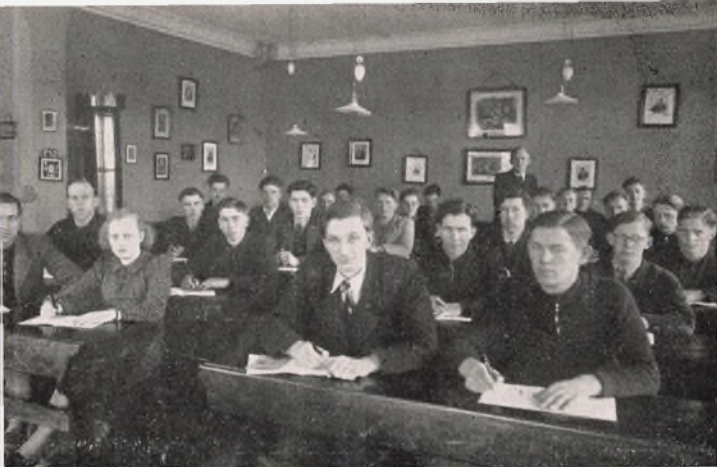
Elever i Skolestue.

Slægter drage os forbi, og de vil have noget at fortælle os, som vi ikke kan undvære.