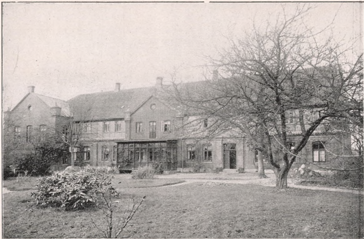
Skolen set fra Haven