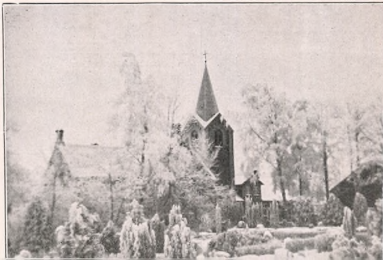
Valgmenig- hedskirken i Rimfrost.

Vi er ogsaa ude at se nogle af Hads Herreds bedste Besætninger, og disse Ture ud til det praktiske Arbejde er en Oplevelse, ikke mindst for os, som har staaet og doceret Teorierne i Skolestuen. Man lægger Mærke til, hvor Landmandsgerningen har de unges Interesse. Her ude i Mark og Stald føler de sig hjemme,