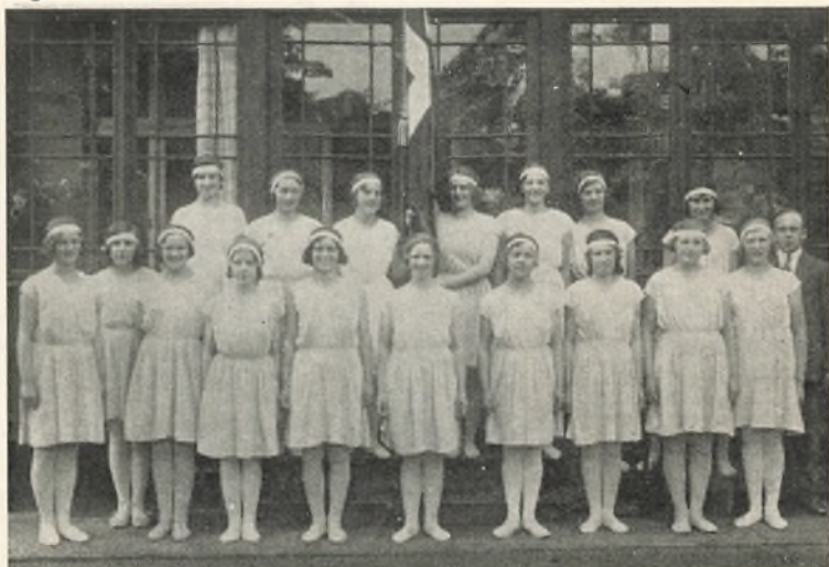
I den solfyldte Dag vil vi løfte vort Flag.

Den sidste Søndag havde Pigerne arrangeret en smuk Udstilling af Skolekøkkenarbejde og hvad, der var lavet i Sytimerne. Desuden var der Opvisning i Gymnastik og Folkedanse. Den sidste Aften samledes vi i Stuerne med Lærere og Elever til Afskedsfest.