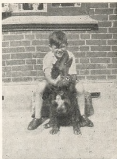
To gode Venner.

tet tage dem i Brug til Elever i Vinter, vi har nemlig 8 Elever mere i Vinter end sidste Vinter, og da meldte jeg jo endda om det største Hold, og jeg har lige faaet Meddelelse om, at der er 42 Mænd, der har faaet Understøttelse til vort Kursus i Januar. En og anden tænker maaske, hvordan vi faar Plads til saa mange. Det gaar nu nok. Hvor der er Hjerterum, er der ogsaa Husrum.