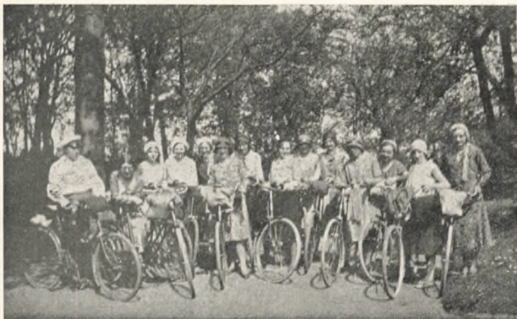
Klar til Start!

kommer til at sætte sit Præg paa et mindre Hold, og det følte vi sidste Sommer, at vore unge Piger sluttede sig til os.