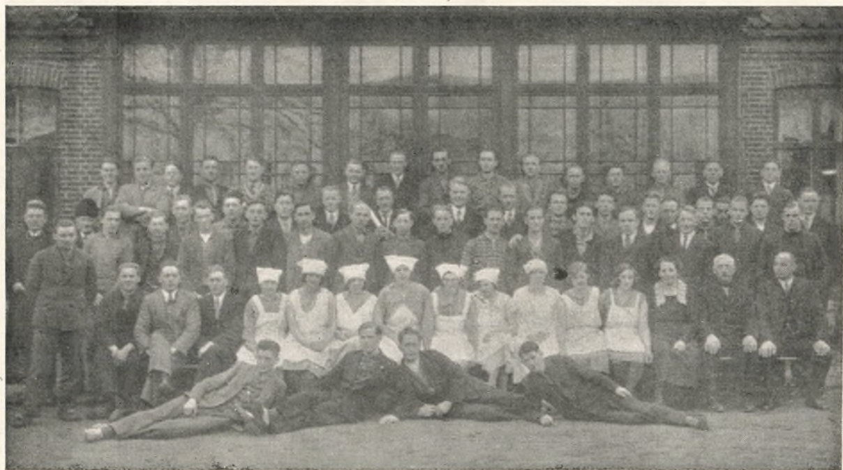
Vort „Rejsese!skab“ i Januar 1932.