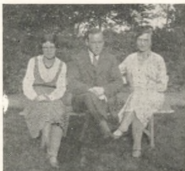
Der stod en Bænk i Haven.