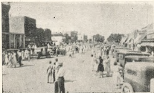
Hovedgaden i Oberlin.

Her omkring Oberlin er der foruden Amerikanere to svenske Kolonier og en tysk Koloni, jeg har opholdt mig en Tid i en af de svenske Kolonier; men er nu mellem Amerikanere igen.