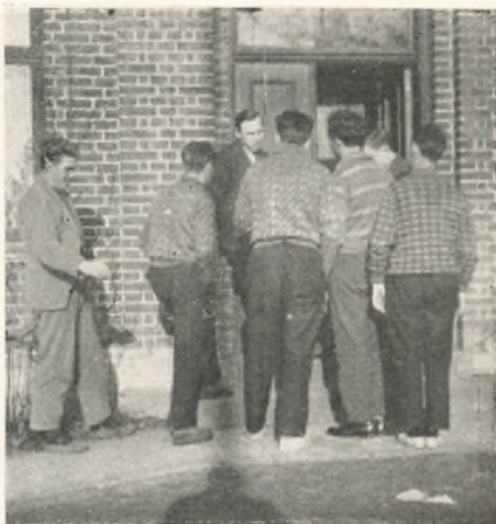
Der drøftes noget meget vigtigt.

Ogsaa Turen til Aarhus, med Besøg i den gamle By, Museet, Domkirken og Oliemøllen for saa til sidst at slutte af i Teateret, er en Oplevelse, vi nødigt vil undvære.