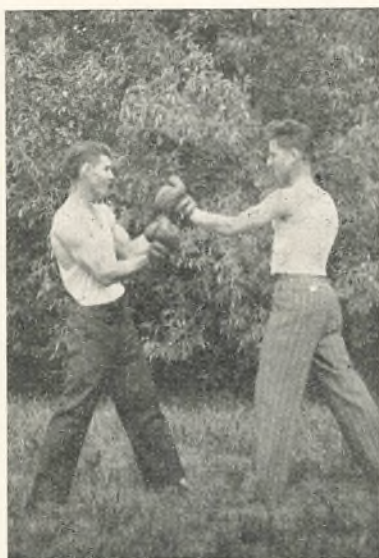
2 gode Venner.

her, saa er Kammeratskabet for det meste stiftet for at holde, og jeg har her Kammerater, der er mere for mig, end de Kammerater var, jeg havde i Danmark.