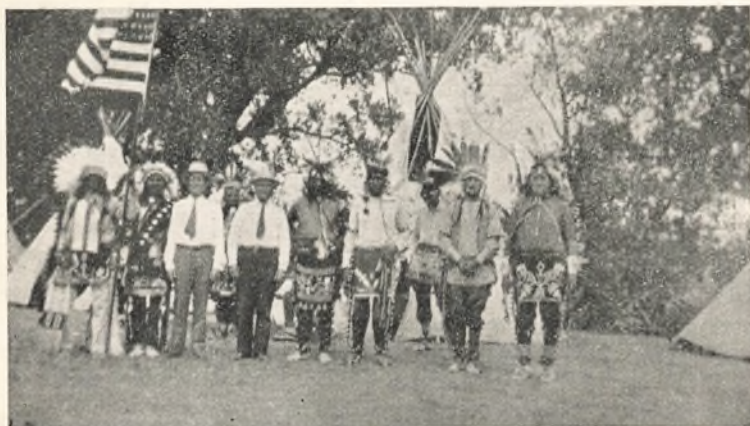
Blandt festklædte Indianere.

Jeg ankom her til Oberlin den 23. Marts og har været her omkring siden den Tid. De første fem Maaneder var jeg hos en Dansker. Den 1. September samme Aar, jeg kom her over, begyndte jeg at gaa i Skole. Det var en Skole, der har megen Lighed med de danske Realskoler.