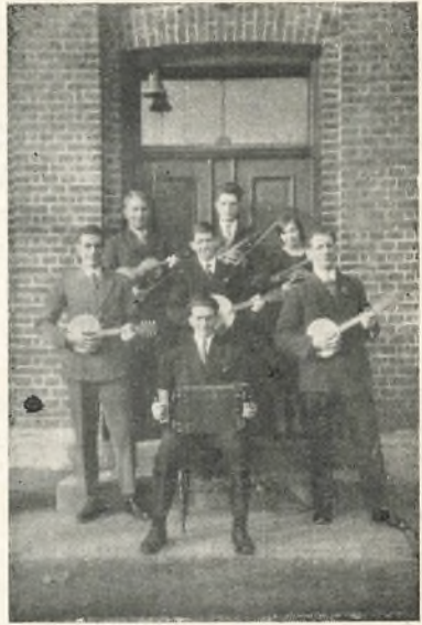
Og vi er Musikanter.