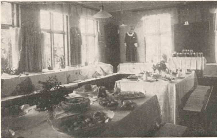
Et lækkert Hjørne.