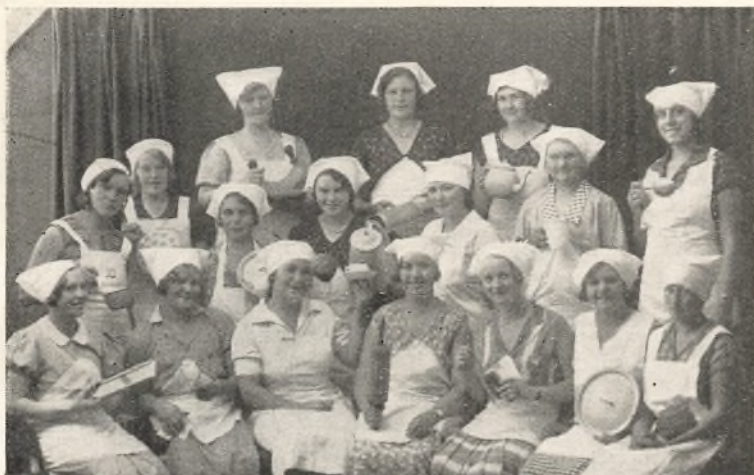
Enhver har sit at passe.

For os paa Skolen er det, ligesom Sommeren holder sit Indtog den Dag, Eleverne kommer. Der er ogsaa noget saa lyst og festligt over en Flok lysklædte og smilende unge Piger, og saadan var vort Indtryk hele Sommeren.