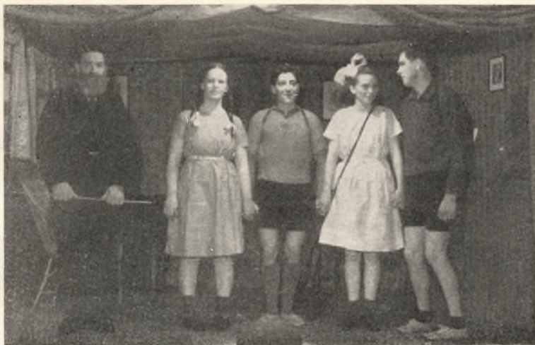
Fra „En Skoletime.“

værdige Gammelmandsskikkelser eller i Situationer, de nødvendig vilde udsætte sig for ved andre Lejligheder. Det kan være noget saa kosteligt, saa man kan more sig over det længe efter. I den Henseende stod sidste Vinter fuldt paa Højde med de foregaaende. Da Fastelavnssøndag oprandt, kunde vi, trods forrygende Snefog — hænge den røde Lygte ud, og „Kloge Ellen,“ blev spillet med Vid og Lune. Det var da ogsaa en velfortjent Klapsalve, der lød fra Forsamlingen, da Tæppet gik ned.