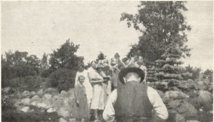
Dobbelt Fotografering i Botanisk Have.

Herlighed at prise, det mindste, han har skabt, er stort og kan hans Magt bevise.“ Jo, disse Ture ud i Naturen kan vi ikke undvære. Man rystes ogsaa saa dejligt sammen, naar man saadan slaar sig løs. Snakken gaar lystigt, og man vender forfrisket tilbage, ja, næsten som fornyet til at tage fat paa det mere alvorlige, baade hvad