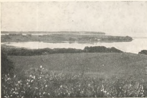
Udsigt fra Uldrup Bakker.

Ind mellem Skovene ligger det lille Fiskerleje og Badedsted Hou, der er Endestation for Aarhus - Odder - Hou Banen. Her er fuldt op af Badegæster om Sommeren, der bor rundt omkring i de smaa lave Fiskerhuse. Den ret store Fiskerihavn med sine mange Fiskerbaade og Lystsejlere, sine udspændte Net, de brune snaddesmøgende Fiskere, der bøder Garn, Duften af Saltvand og