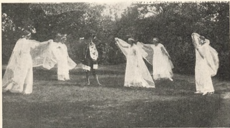
„Og hør Du, Hr. Oluf! Træd Dansen med mig.“

Da Skumringen begyndte at lægge sig over Pladsen,