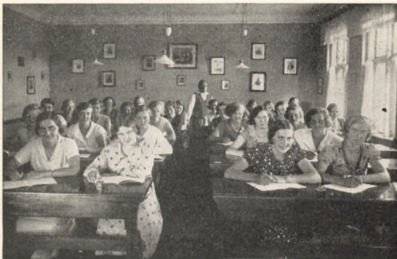
En Time i Dansk.

Det blev derfor en af disse gode Somre, vi oplevede, med Solskin baade ude og inde, og Tiden gik hurtigt, ja, alt for hurtigt, inden vi rigtig vidste af det, var vi i Slutningen af Maj, og vi skulde til at tænke paa Sommerens store Begivenhed, Elevmødet. Da det i Aar faldt paa St. Hansdag, var det ret naturligt at vælge noget til