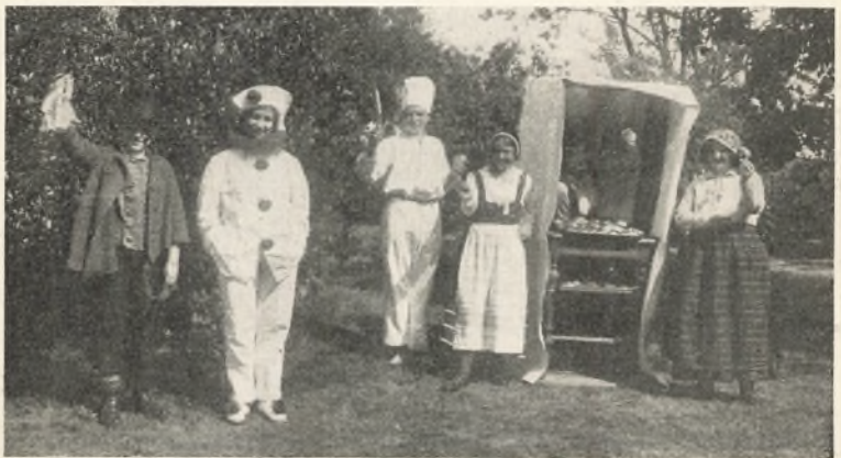
Teltholdere m. fl.

Med smaa Mellemlum kom saa de forskellige Optrin. Først kom et smukt, gammelt Hestekøretøj belæsset med