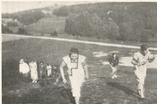
Hvem kommer først?