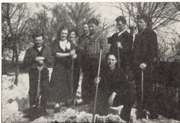
Hvil under Snegravning.

Og saa oprandt den 3. Maj med Solskin og en god