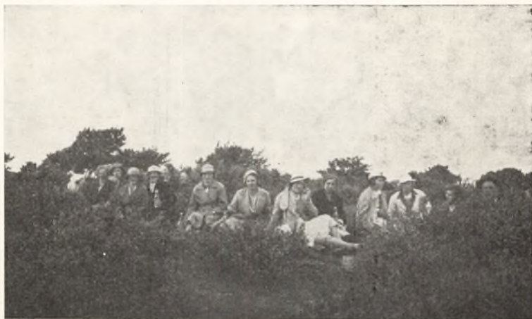
Maden nydes, og Gyvelen blomstrer. Fra Sønderjylland.

For hvem, der første Gang skal over Grænsen, er der altid noget spændende ved, hvad der vil ske, men