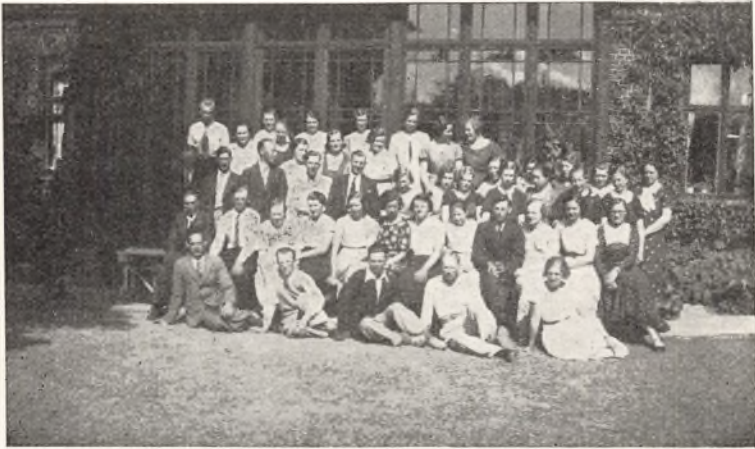
Dagen efter Elevmødet.