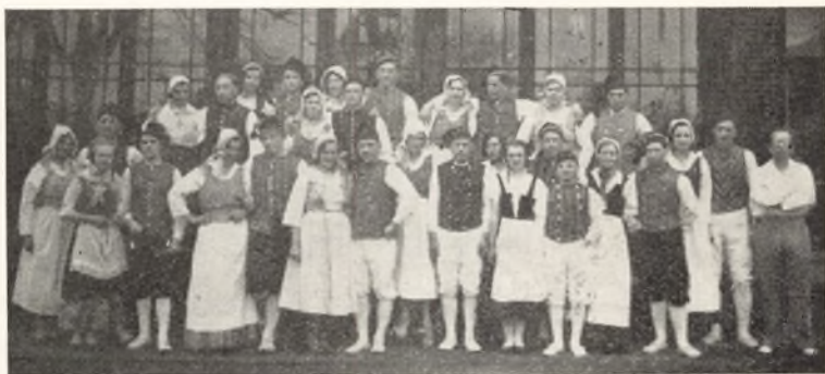
Fra de fornøjelige Stunder.

det ogsaa virke vejledende og opdragende, men saa længe Ungdommen kan holde sig ung i Ordets bedste Betydning, da behøvær vi ikke at se alt for mørkt paa Fremtiden, for da skal de unge nok tage de Opgaver