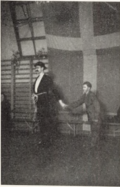
Fy og Bi.

naar mine Tanker til at begynde med har formet sig som det foregaaende, saa er det vel nok fordi, vi gerne vilde, at det skulde være Understrømmen i hele vor Undervisning. I hvor høj Grad det er lykkedes, maa I svare paa.