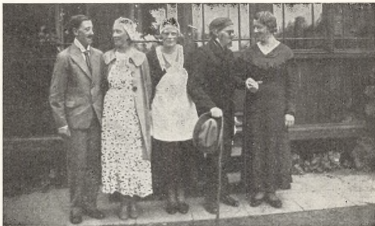
En pokers Tøs.

Del. Vi er ogsaa glade for at Tilslutningen Lørdag Aften bliver større og større Aar for Aar. Mange skriver, vi kommer Lørdag Aften, for vi vil saa gerne være med til Morgensangen og Andagten Søndag Morgen; andre