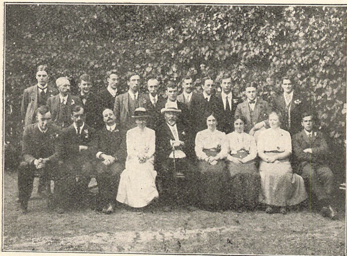
Engelske Lærere og Fircroftstuderende.