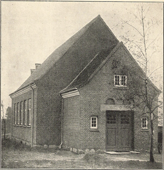
Den nye Foredragssal.