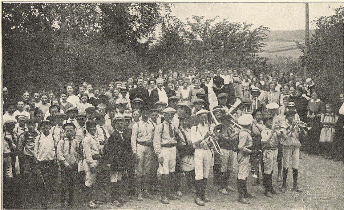
En Flok Dreng fra Holstebro, der var paa Marchtur gennem Fyn, besøger en Sommerdag Højskolen.