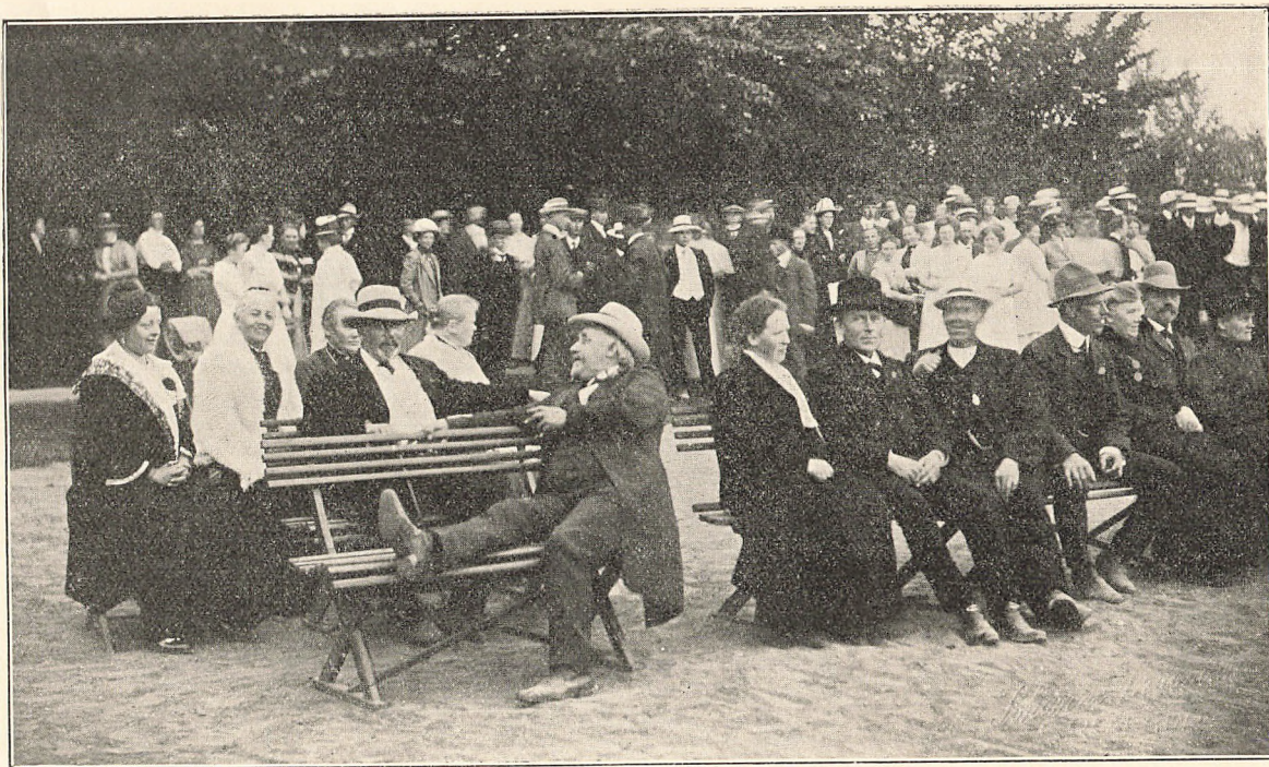
Fra Elevmødet. Man hører paa flerstemmig Sang