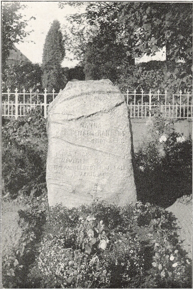
Mindesmærket paa Fru Nannas Grav.