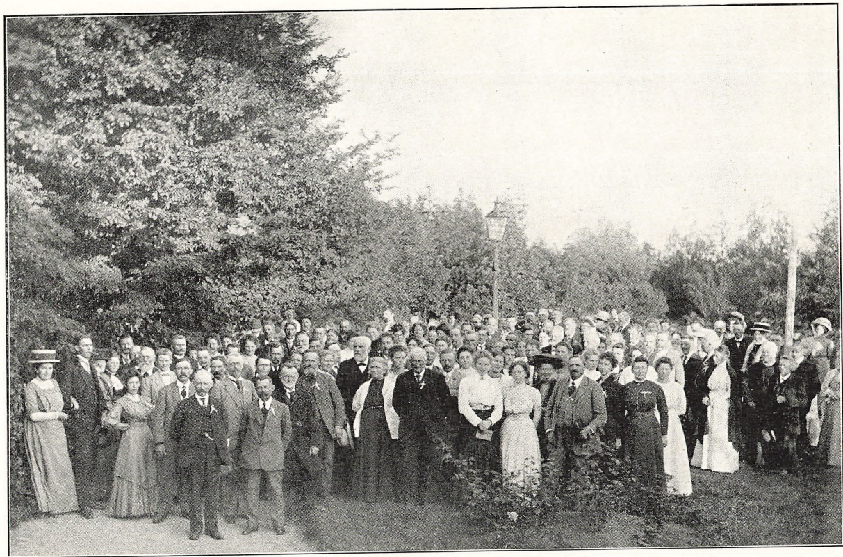
Fra „Det 3die dansk-amerikanske Stævne“ paa Ollerup Højskole, August 1910.