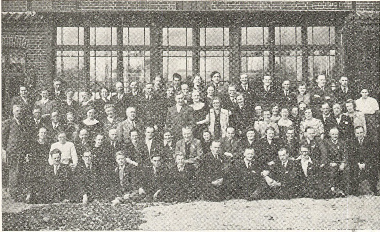
Folke-danserholdet, der genindviede Højskolen.

Vi har lært at elske Danmark, hver en dyr og omstridt Plet, vi vil vogte Fædres Minde, vi vil værne om vor Ret. Vi har valgt den største Herre, og staar fast som Væbnervagt, vi gaar frem med hævet Pande og med Livets Gud i Pagt.