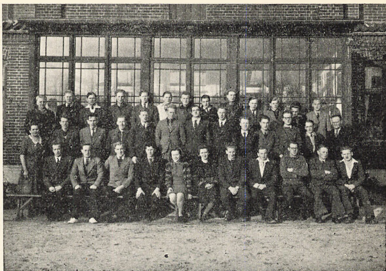
Det nye Elevhold, 1945—46.

lig i vor Tid. Men det bedste ved det hele er alligevel dette at komme til at virke i den Gerning, man har sat sig som sin Livsopgave, og som man elsker. Det er først, naar man bliver optaget af den Gerning, at man rigtig finder sig selv igen og kan glemme en Del af det, man helst vil glemme fra disse lange og mørke Aar. Besættelsestiden er slut, og Odder Højskole er gaaet ind i en ny Tid.