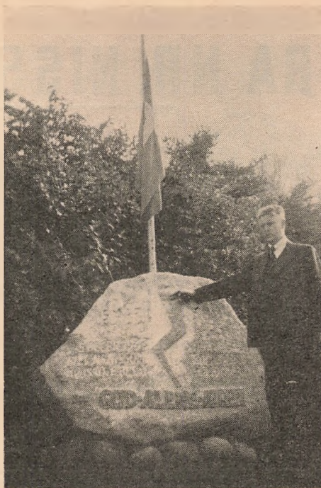
Mindestensafsløringen, Elevfesten 1947

Indkvartering : Ældre og svagelige Festsdeltagere, der ikke kan taale Indkvartering paa »Feltfod«, kan vi skaffe Logi til (Lagener og Haandklæder bedes medbr.). Ellers forbereder Mændene sig i Almin-