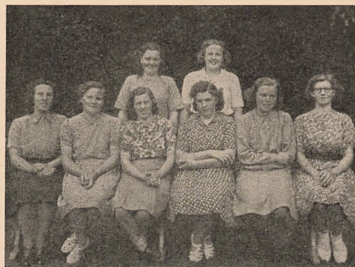
Forreste Række: Søsken, bageste: 2. Generation

ner at have sejret over og mine idealer? Hvad siger Gud? og hans Ord? At det hele er ormstukket, at mine fjender har ret, at jeg ikke er en smule bedre end de! At mine skønneste ord og ædleste motiver bunder i egoisme, at mine idealer er sammensat af æresyge, at jeg er uren fra yderst til inderst, at alle mine tilsyneladende sejre er nederlag, og at jeg intet har at vise frem. Hvad er grunden? Jo, det hele har sit udgangspunkt et forkert sted, nemlig hos mig selv — kong »jeg« sidder paa tronen — trods alt. Hvad har jeg saa at gøre — eet eneste , og der er forskellen paa de, der trods alt tør tro, at Gud er en virkelighed, og de, der ikke regner med ham, at du og jeg giver Gud ret, at vi indrømmer, at han er den helige, rene Gud, og jeg den urene, syndige, som kun tør leve mit liv videre, fordi jeg ved, at der er een, som vil redde mig, som har sejret, for at jeg engang skal naa sejr. At vi overfor ham og overfor mennesker, ogsaa vore kritikere, indrømmer, at vi kan ikke selv, at vi er ikke bedre, men tror, at Gud for Jesu Kristi skyld vil erklære os fri — erklære os rene for hans offers skyld, at Gud, naar han ser paa os,