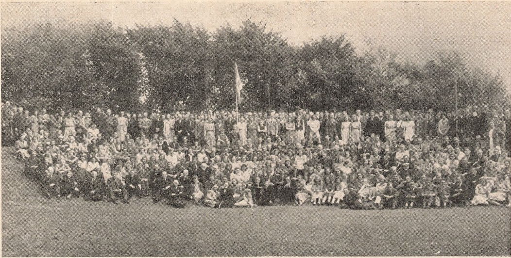
Fra Elevfesten 1948

ikke tænkt nok over Guds Dom over Hjerterne. Han maatte ydmyges og se, at det var baade Gud og Mennesker, han havde syndet imod.