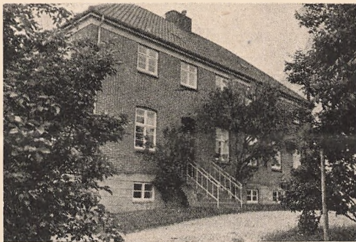
Indgang til »Privaten«