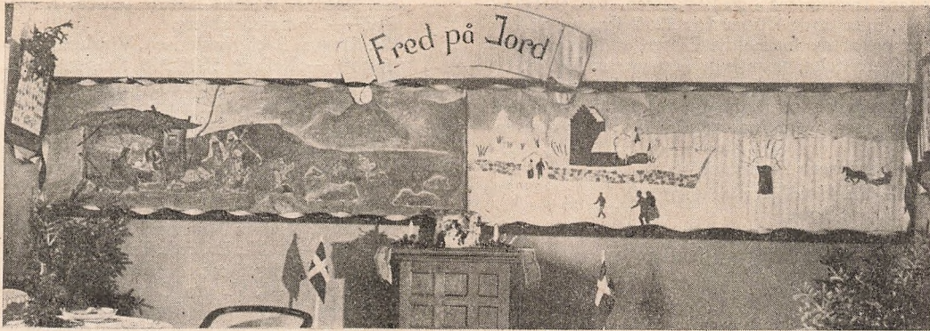
Julestuen var i år ualmindelig smuk og festlig. Den sorte tavle i den store klasse dækkedes helt af to malerier, som et par af eleverne var mestre for, og træet med de tændte lys var naturligvis stuens midtpunkt.