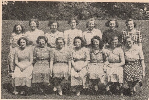
Vore søskende har været her