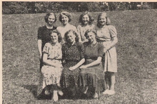
Vore bedsteforældre har været her