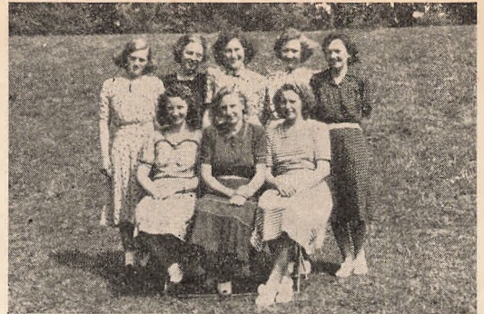
Vore forældre har været her

4 fra Sjælland stående. De 3 siddende er fra Lolland, Bornholm og Fyn