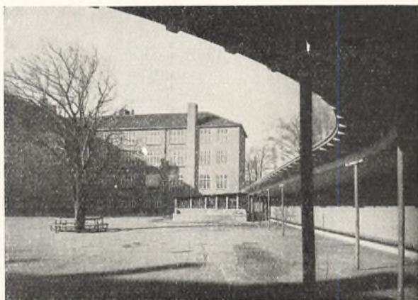
Skolen set fra et hjørne af legepladsen