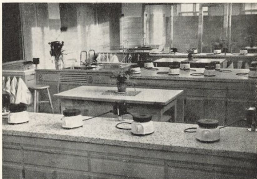
Et kig ind i skolekøkkener