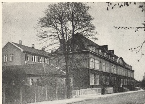
Skolen set fra Skolevej