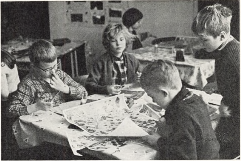
Gruppearbejde i 2. klasse.