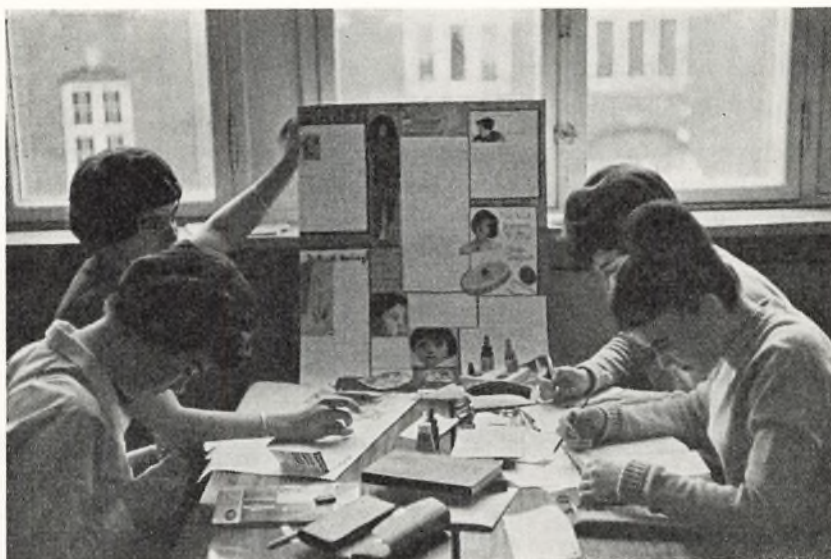
Gruppearbejde i realklassen.

Stadig flere elever melder sig da også til fortsat skolegang ud over den skolepligtige alder. I år skal vi for første gang have en 9. klasse op til prøve, og fra næste skoleårs begyndelse indfører København også 10. klasse.