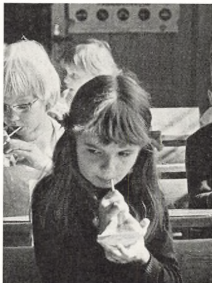
Hun er „mejerigtig“.