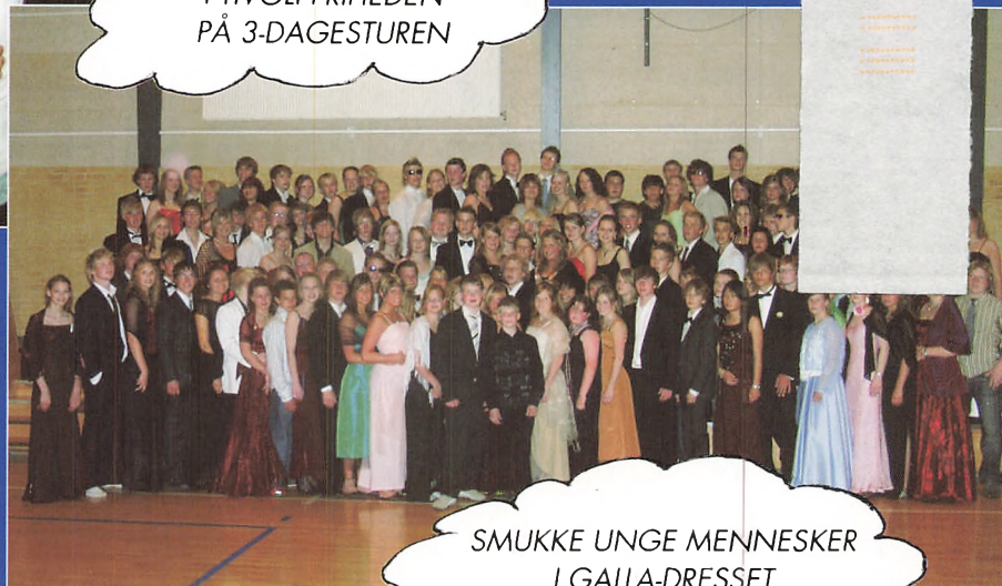
SMUKKE UNGE MENNESKER I GALLA-DRESSET