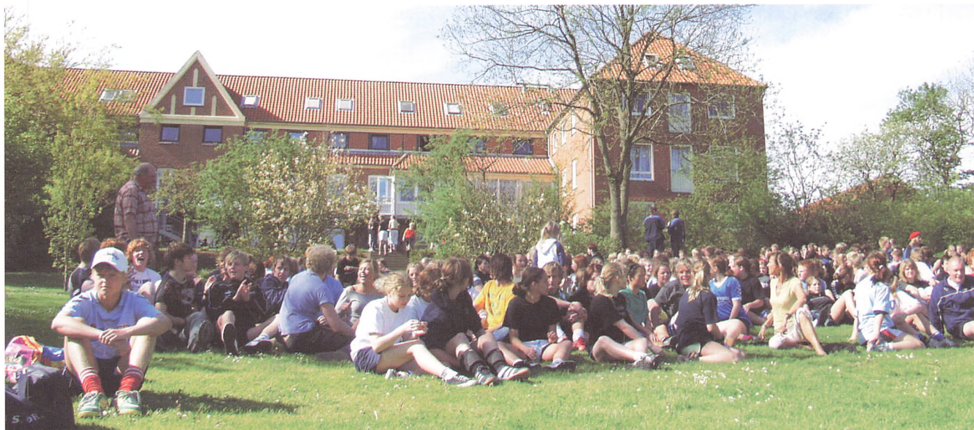
Skolemor og skolefar på plænen med alle »ungerne« på idrætsdagen.

Det er også dette ord jeg vil mejsle ind i bestyrelsens beretning til sidst. TAK skal der stå med store blokbogstaver. TAK til alle ansatte på skolen, for jeres iver og entusiasme for at gøre skolen til en god kristen efterskole, der gør noget værdifuldt ved vores unge mennesker. TAK