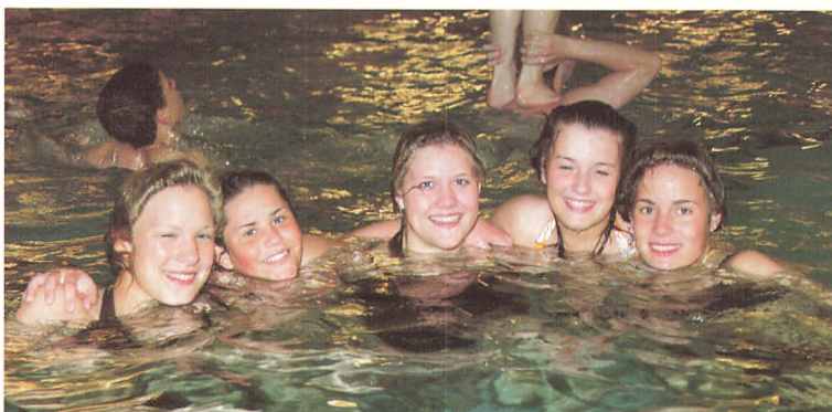
Seje sild tager en dukkert i skolens svømmehal