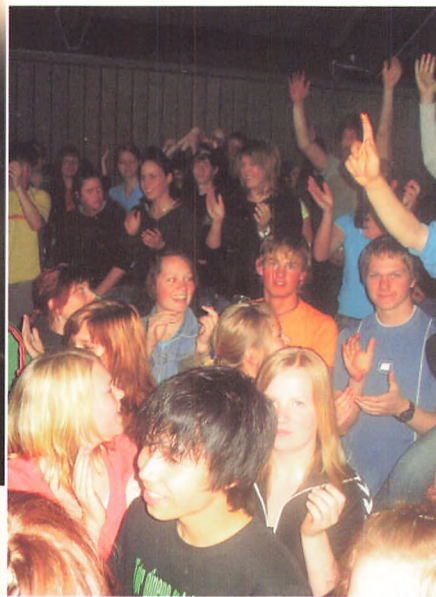
Det regionale MGP blev afholdt På Rydhave Slots Ungdomsskole og stemningen var helt i top