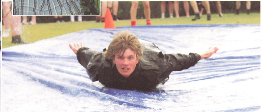
Fart over feltet, da Redningsringen leverede vand og skum en aften i juni