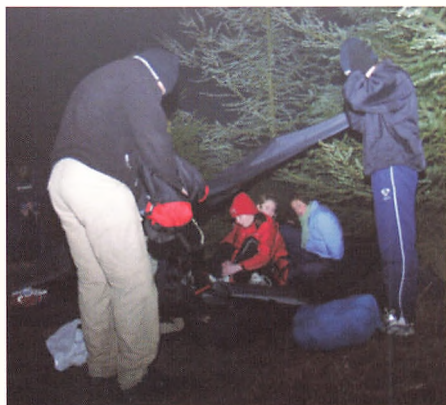
Der bygges og indrettes et shelter.

VI ER GODT NOK TRÆTTE, MEN LIDT BÅLHYGGE VIL VI ALTSÅ HOLDE OS VÅGNE TIL