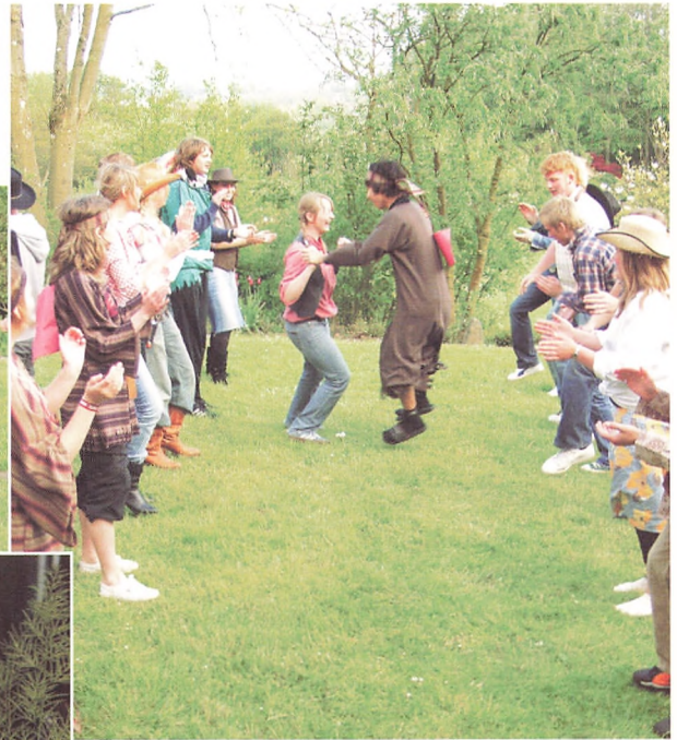
Foryggende Line-dancing ved westernfest arrangeret af 9.b