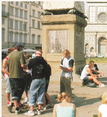
Almen studieforberedelse midt i renessansens Firenze

Som eksempel på et allerede gennemført forløb kan nævnes et samarbejde mellem biologi, engelsk og dansk omkring genteknologi. Denne problemstilling indgår