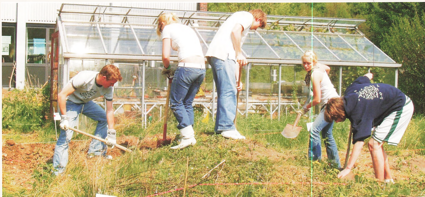
Elever fra 2. g 03/04 i gang med de første spadestik til sciencehaven, maj 2004

En gruppe lærere begyndte på tegnebrættet - 625 m 2 mere eller mindre vildskov, hvad kunne det blive til? Syv terrasser med bord og stole til fire, det ville passe til en klasse. Nogle højbede mellem terrasserne med stauder og buske, det ville give lidt arbejdsro og også se lidt pænt ud. Drivhuset skulle igen til ære og værdighed, men lidt skov måtte vi vel bevare af hensyn til fugle og vilde planter. En vejrstation, et solpanel, et solur, et sted til stjerneikkert, nogle fuglekasser, et foderbræt om vinteren, en kompostbeholder, nogle ledeblokke, nogle vilde danske buske. Ja, idéer var der nok af. Men det ville koste en formue at få anlagt.