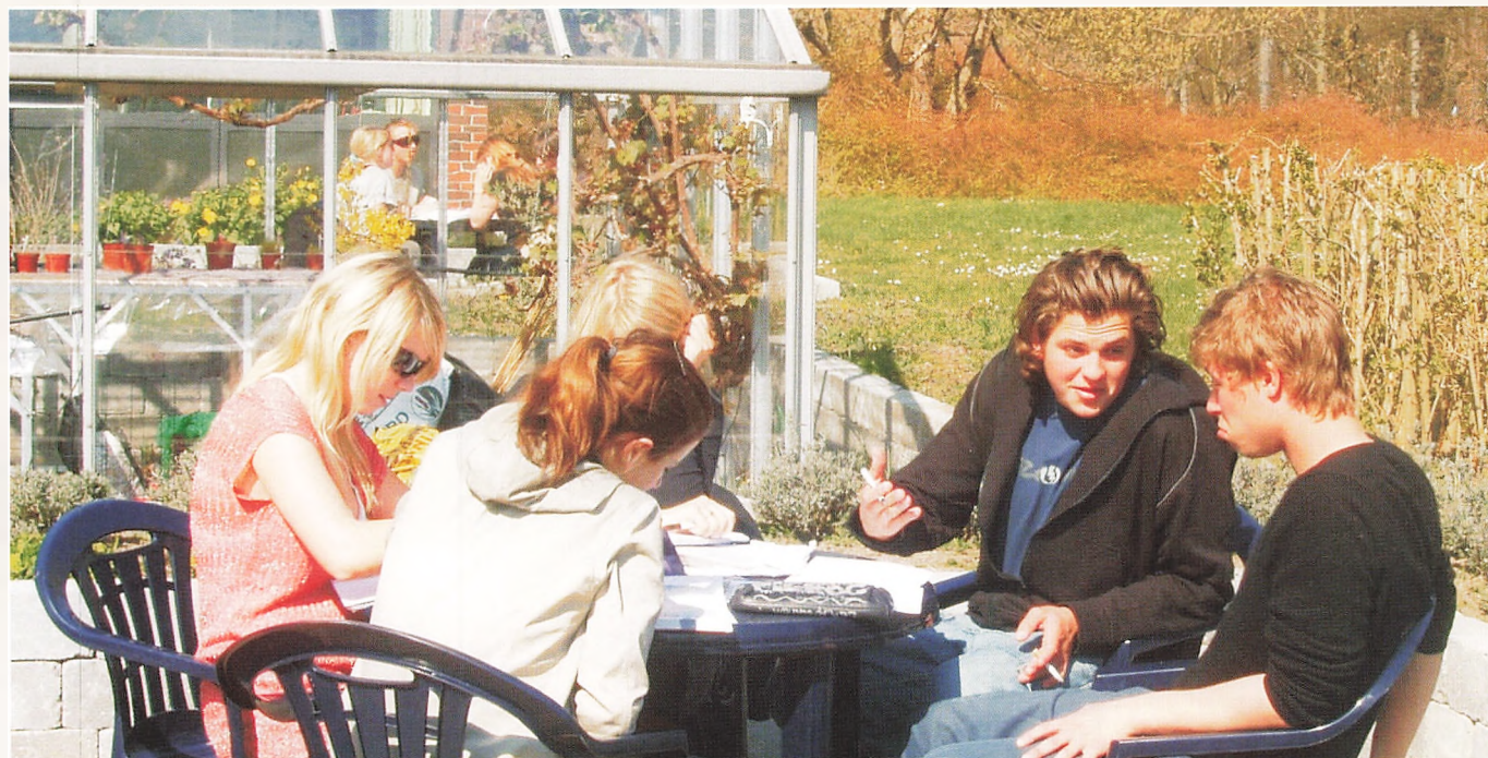
Elever fra 2. a 04/05 har gruppearbejde i sciencehaven, april 2005

Tak til årets studenterårgang for deres indsats. Mange elever efter jer vil få glæde af sciencehaven - og forhåbentligt kommer I forbi og kigger til den en gang imellem.