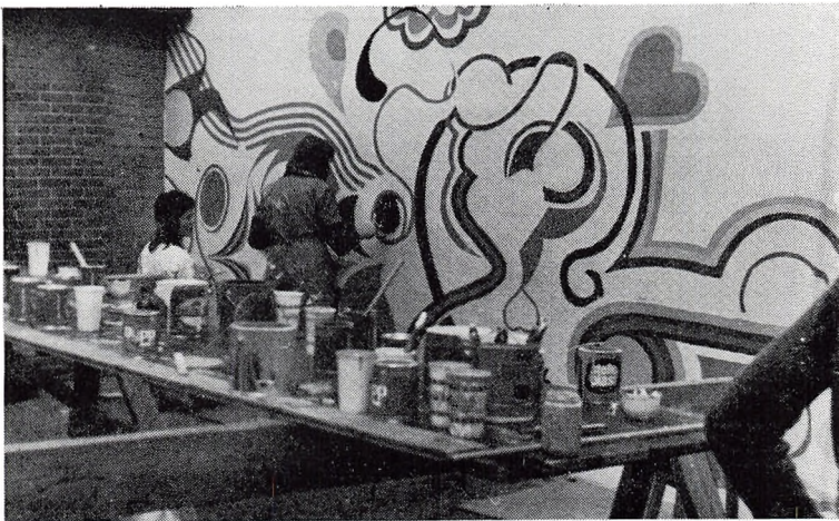
Arbejde på dekorationen i de store elevers gård.

Også overtøj, som eleverne benytter på skolen, bør være mærket med navn.