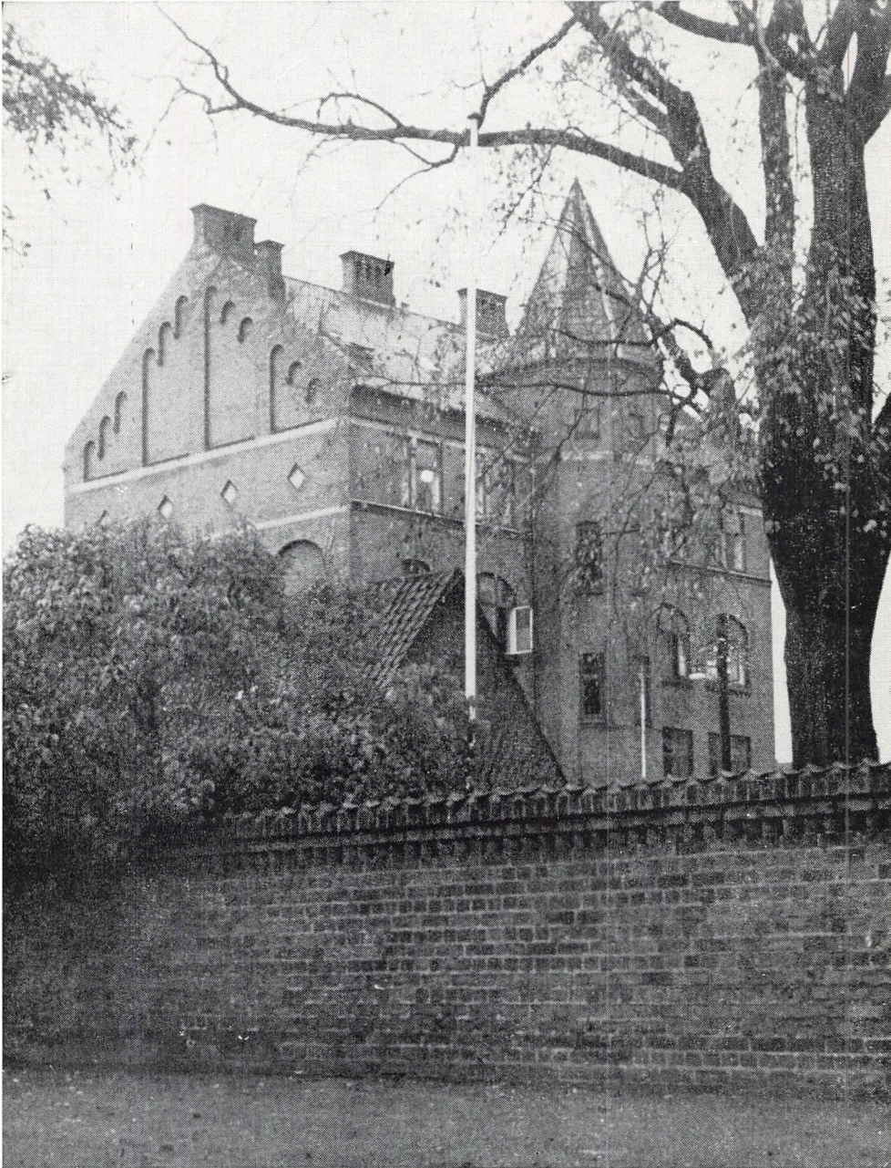
KURSUSBYGNINGEN (Den tidligere drengeskole)