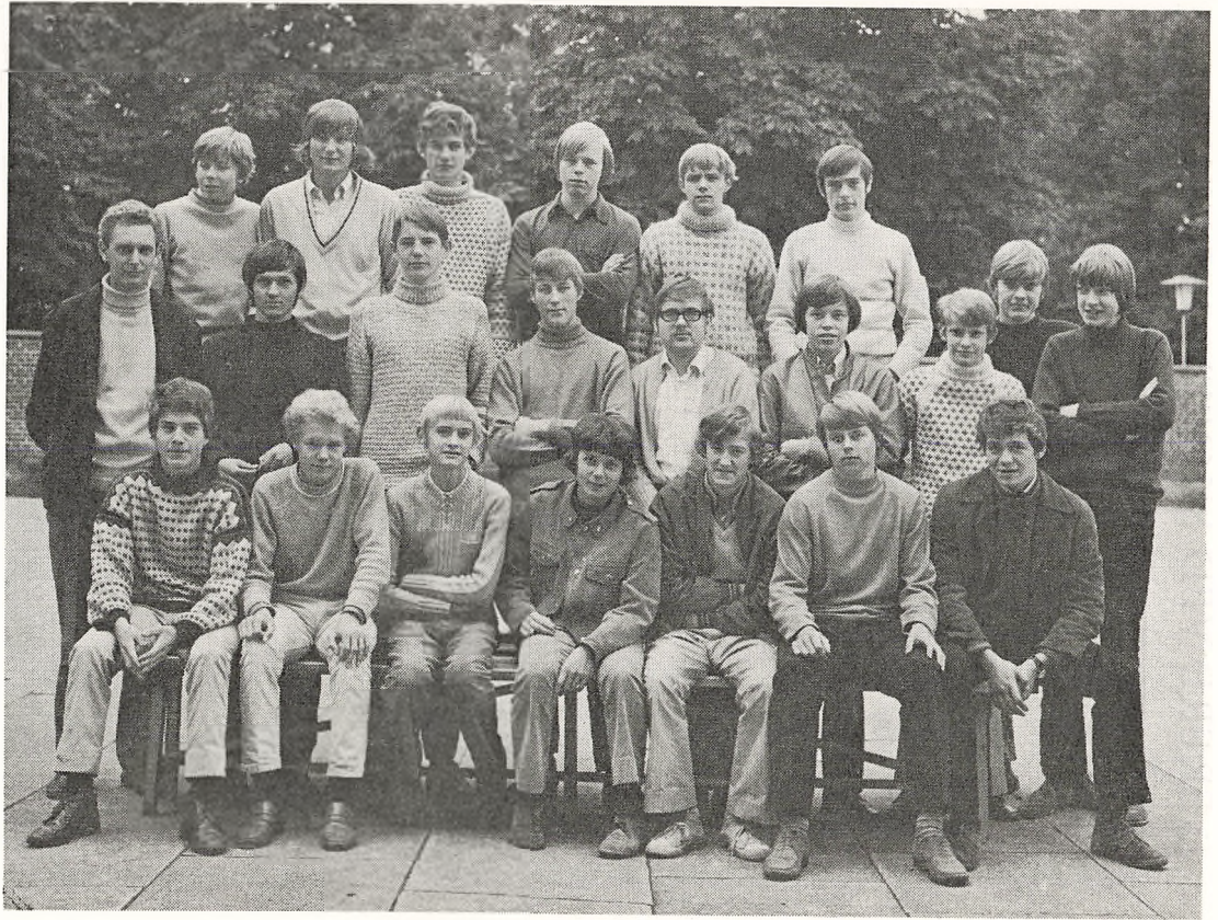
3. real Dreng