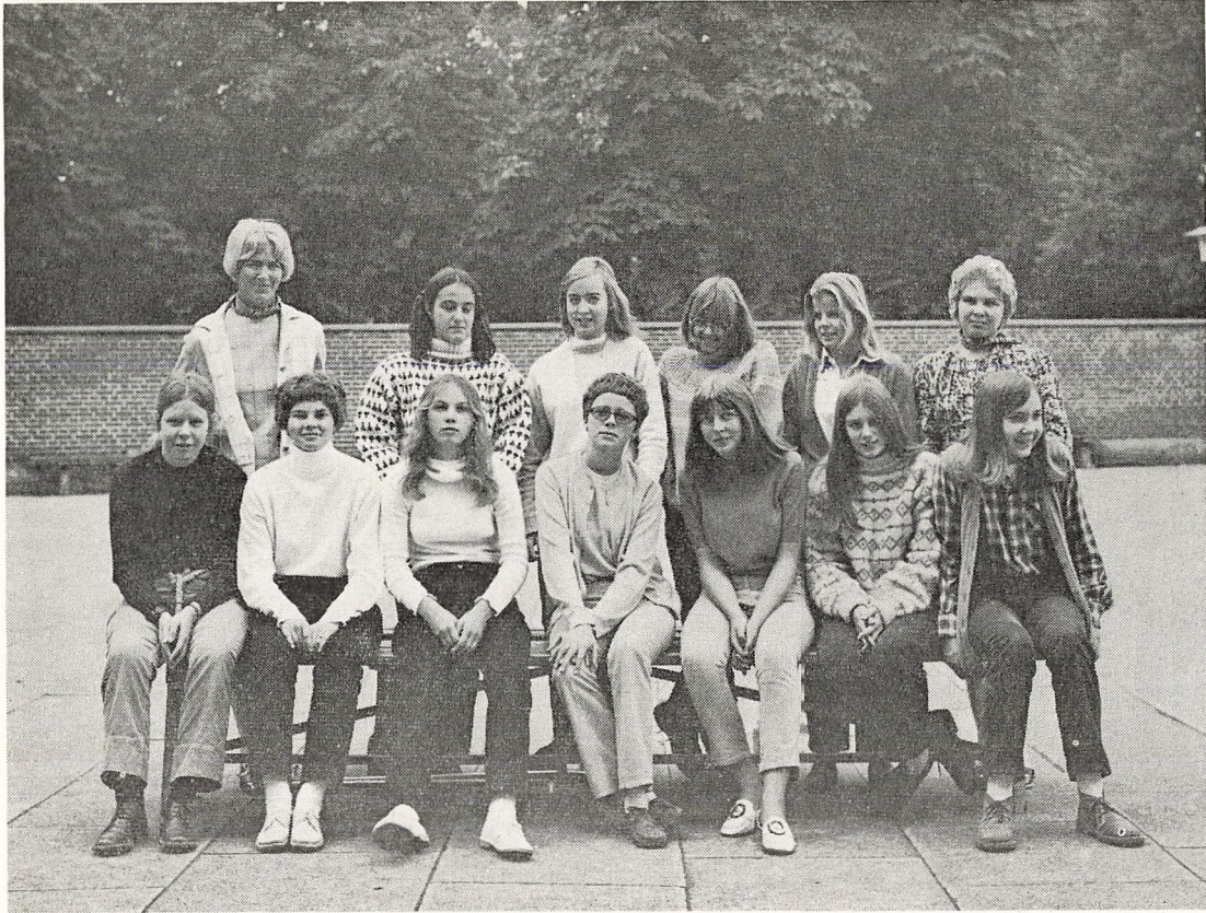
3. real Piger