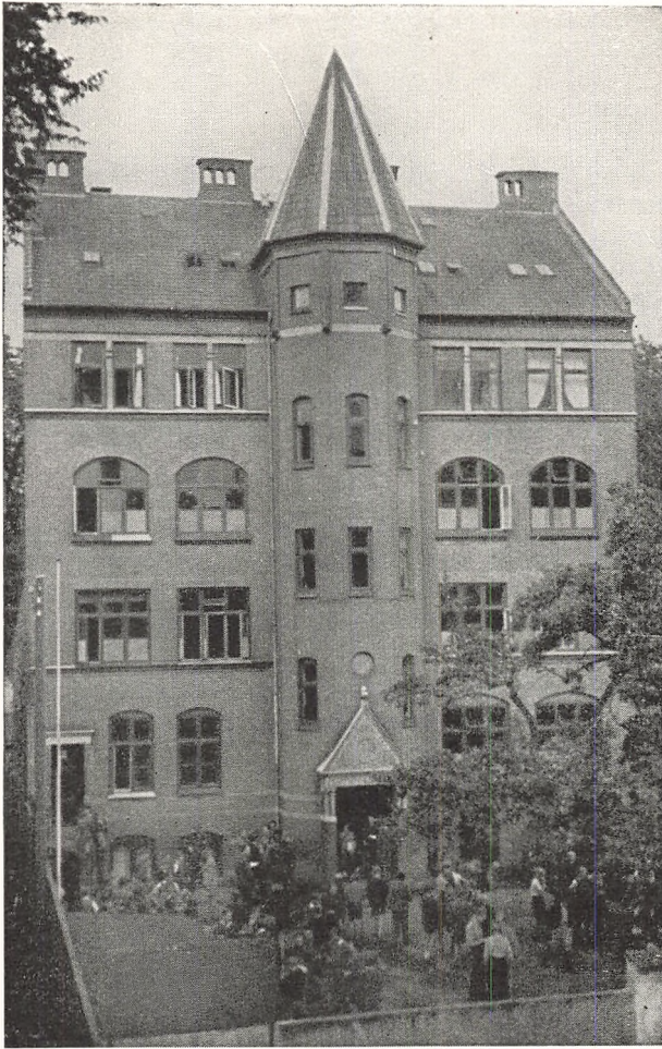
Marie Jørgensens Drengeskole