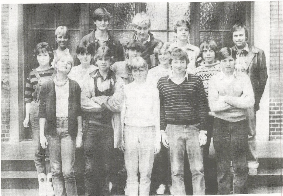
10. a 1982/83