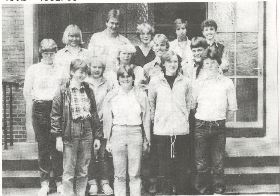
10. b 1982/83