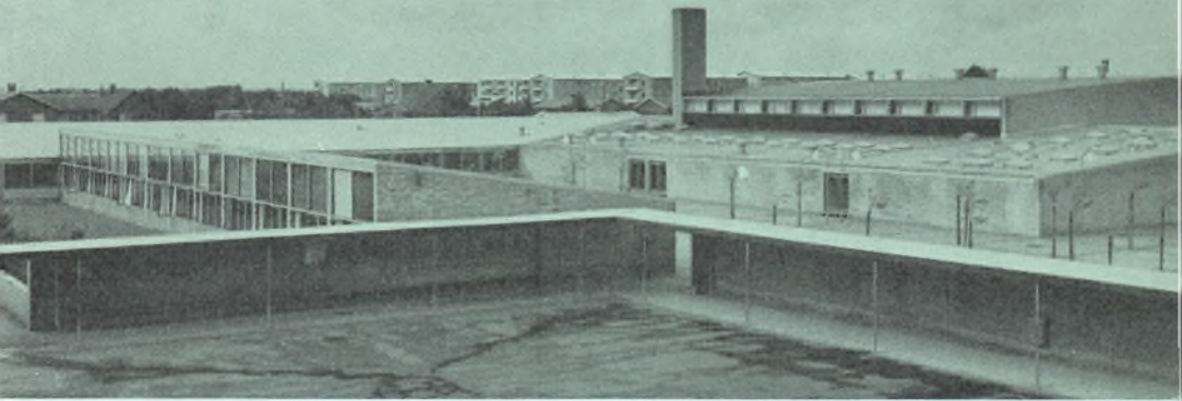
Holstebro Gymnasium er for tiden indkvarteret på Nørrelandsskolen (bygget 1961), men håber, at ministeriet giver byggetilladelse til det nye faglokalegymnasium i 1964.