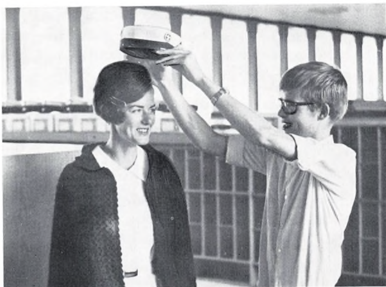
Juni 1968 dimitteredes det første studenterhold.