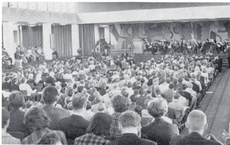
Indvielsen den 6. november 1968.