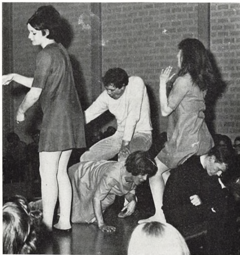
TEAM-gruppen opfører Dylan Thomas' „Forår i Milk-wood“

Foreningen fik navnet „Skive Gymnasiums Kontaktforening“. På generalforsamlingen vedtoges følgende love for foreningen: