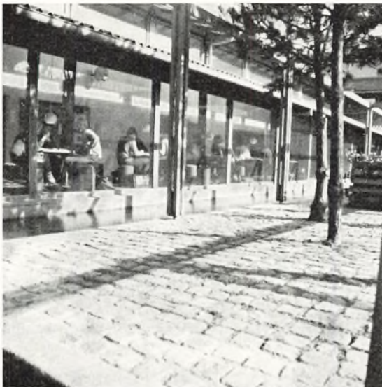
Spisegang set fra vandgården

nariebygningen imidlertid først kan overtages af gymnasiet efter seminariets udflytning i sommeren 1970, vil der for at dække gymnasiets lokalebehov i det kommende skoleår blive opstillet en træpavillon indeholdende 2 klasseværelser.