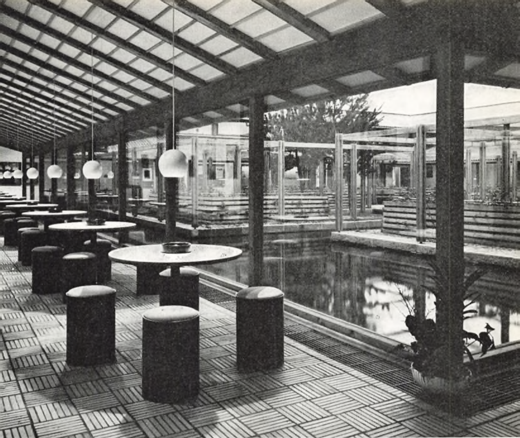
Spisegang og vandgård

Skolens adresse: Skive Gymnasium, Egerisvej, 7800 Skive.