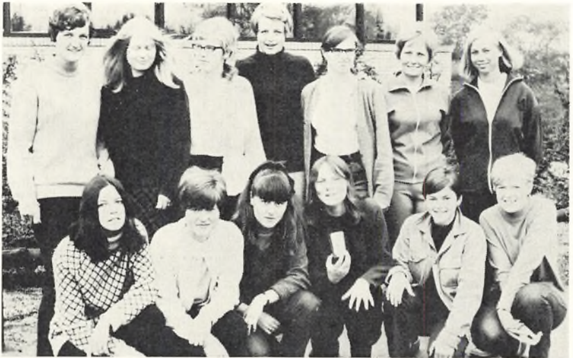
Skolens danmarksmesterhold i håndbold 1968