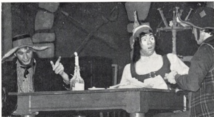
Dario Fo: Lig til salg - februar 1969.