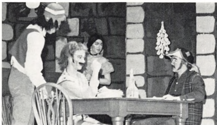
Dario Fo: Lig til salg - februar 1969.