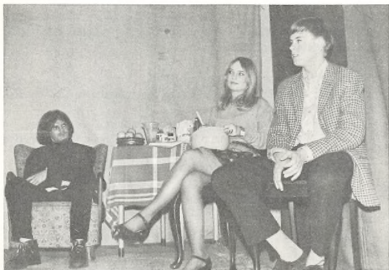
Scene fra »Zigeunerne drager forbi«.

1. oktober 1968: Københavns Strygekvarter spillede værker af Haydn og Debussy.