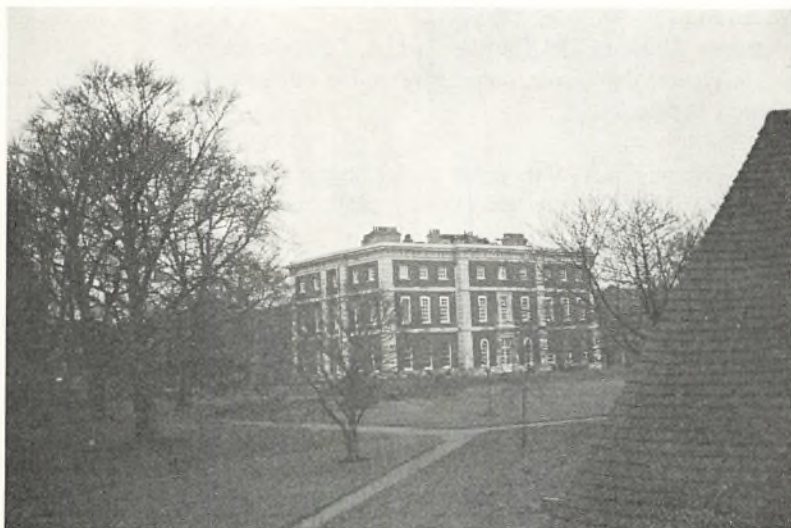
Hovedbygningen på Radley College.

fag og fortrinsvis med emner, der ellers ikke ville blive berørt. 3nf (Jø): Mikrobiologi, laboratoriearbejde og institutionsbesøg, 3x mf, matematik (BrH): Kædebrøker, fysik, (LM): Relativitetsteori, 3y mf, matematik, (EH): Sandsynlighedsberegning, fysik, (Thy): Elektronik, 2a ns, engelsk (Jac): The Art of Painting in England, 2b ns, engelsk (SH): Pinter's Plays, tysk (Si): Brecht: Leben des Galilei.