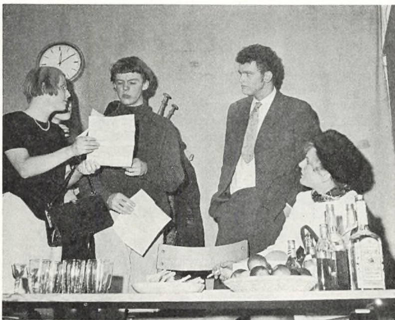
Scene fra »Tovet«.

6. november 1968: Paneldiskussion om Amerika. Panelet bestod af 20 amerikanske High School rektorer.