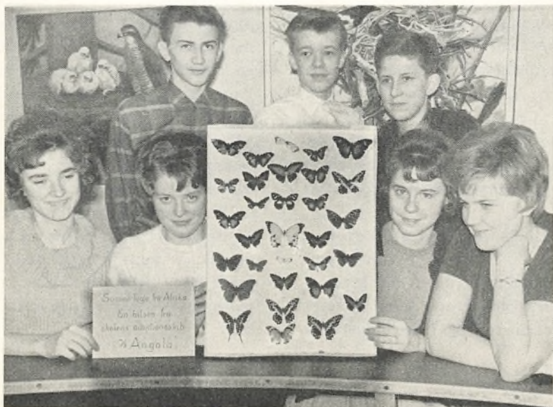
Vi havde den glæde at modtage en samling tropiske sommerfugle fra vort adoptionsskib »Angola«. Den er blevet indlemmet i vor naturhistoriske samling. Her beundrer elever fra IV u gaven.