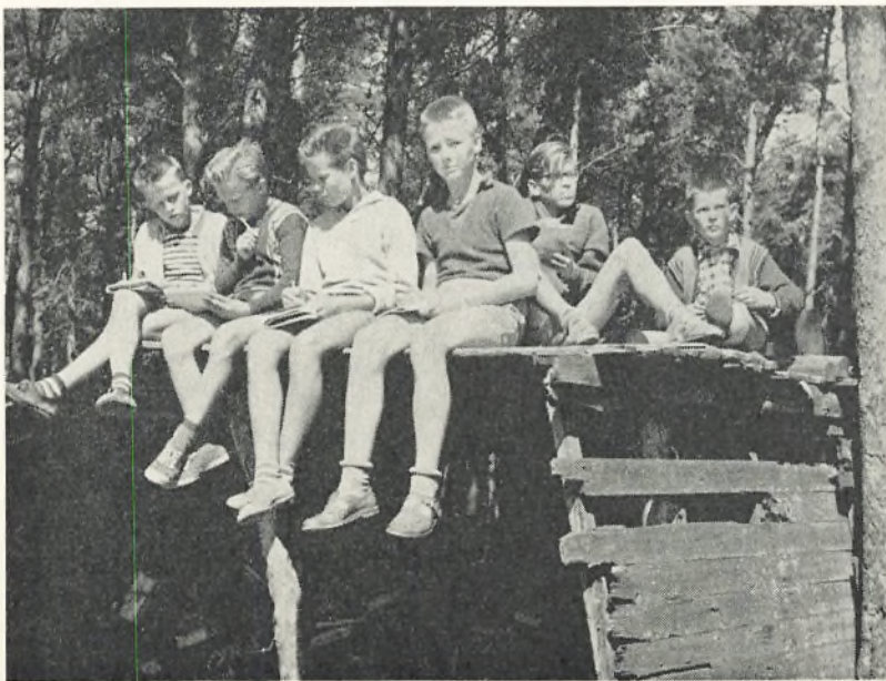
Skolen i skoven.

Det blev så bestemt, at vi skulle til Bornholm, og den 10. september rejste