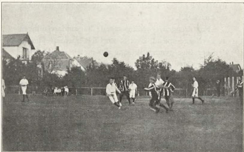
Fra skolens mindre idrætsplads (håndboldkamp med Helsingør h. almenskole).

Skolens større idrætsplads er indrettet til at kunne sættes under vand, således at vi i frostvejr kan have en fortrinlig bane til skøjteløbning. Desværre har