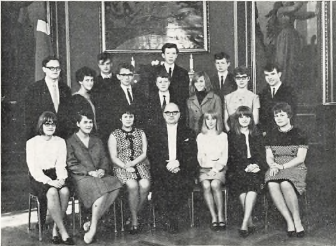
Realisterne — martsholdet 1966