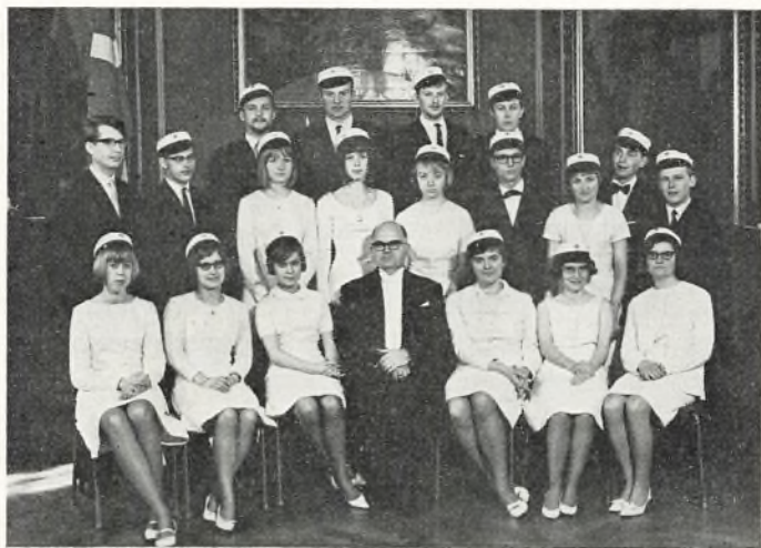
Studenterne — martsholdet 1966