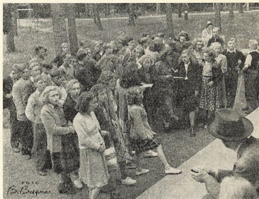
Skolebørn fra Vejle på udflugt til „Majblomman“