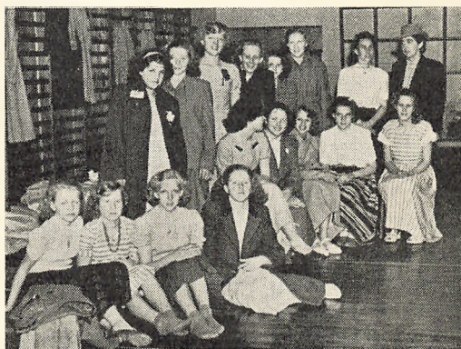
Skolepiger fra Borås

Onsdag morgen byttede vi elever med vore svenske kolleger, og jeg tror nok, at man fra alle sider var spændt på, om forsøget skulle lykkes. Det er klart, at der ikke kunne blive tale om nogen virkelig tilegnelse af et andet sprog på så få dage, selv om det er et »broder-