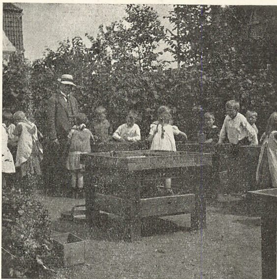
Sandkasseundervisning i Skolehaven.

Ved Undervisningens Begyndelse maaes Sandet med et Litermaal op i Barnets Rum, og til Formning anvendes en Linial, der er 10 cm lang, 5 cm bred og 1 cm tyk. Da hver Side i Rummet er 4 dm, hvilket er afmærket med Søm i Sidekanterne, kan det lade sig gøre at forme plane Figurer efter opgivne Maal, og disse bruges derefter ved Tælleøvelser og gøres til Genstand for lettere Beregningsøvelser. Børnene kan