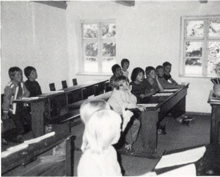
4. klasse i den gamle skole i Den Fynske Landsby.