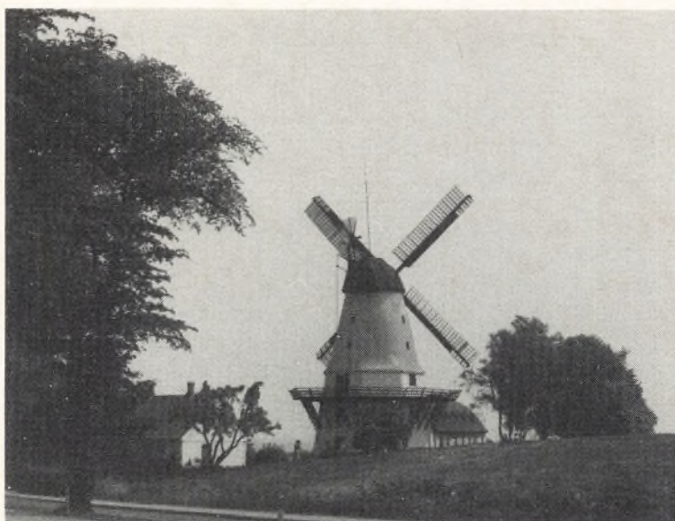
Ved Dybbøl Mølle