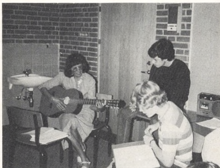
- og så er der hyggeaften