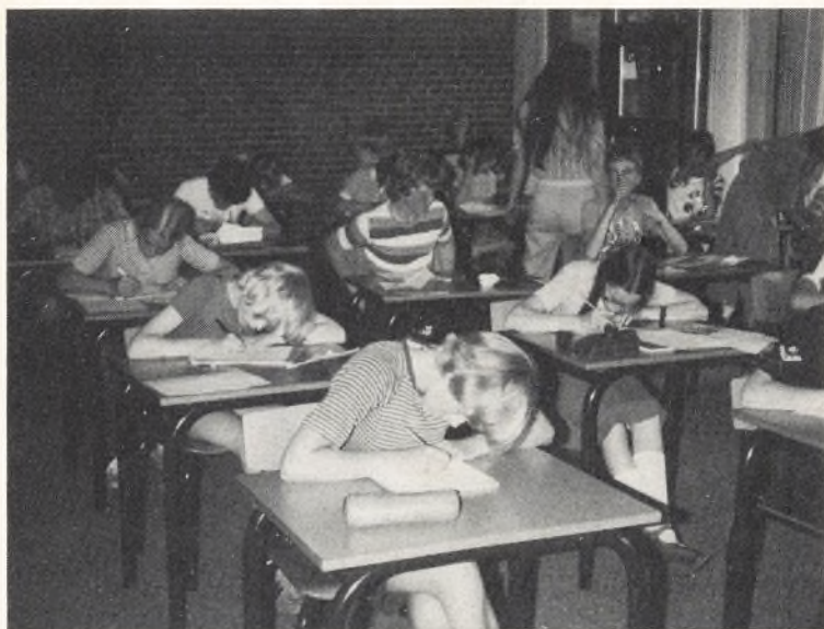
Der skrives rapport