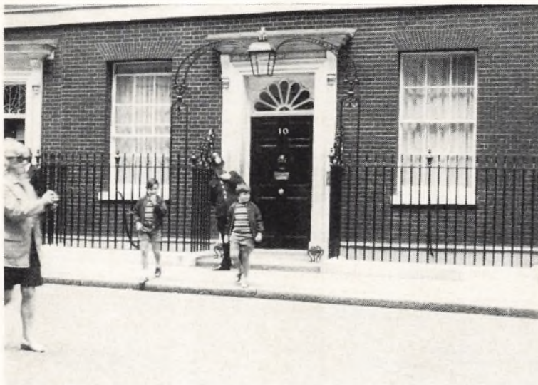
Downing Street nr. 10