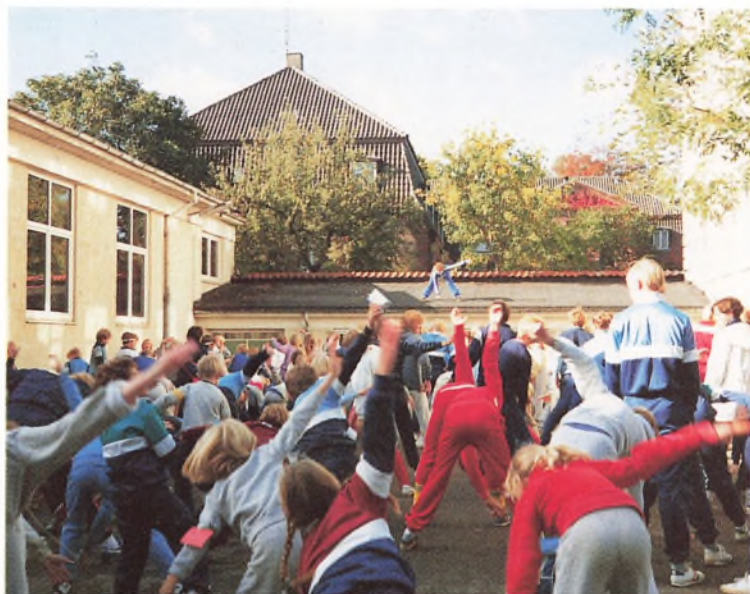
Opvarmning til motionsløb 12/10.