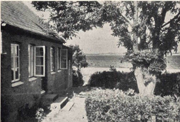
Weekend-hytten ved Helnæs strand