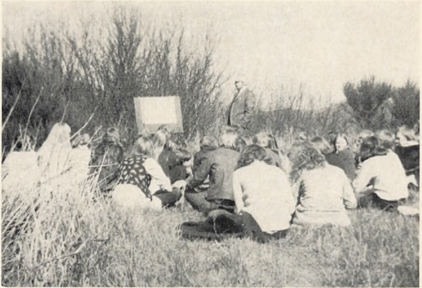
Røjle klints opbygning forklares —