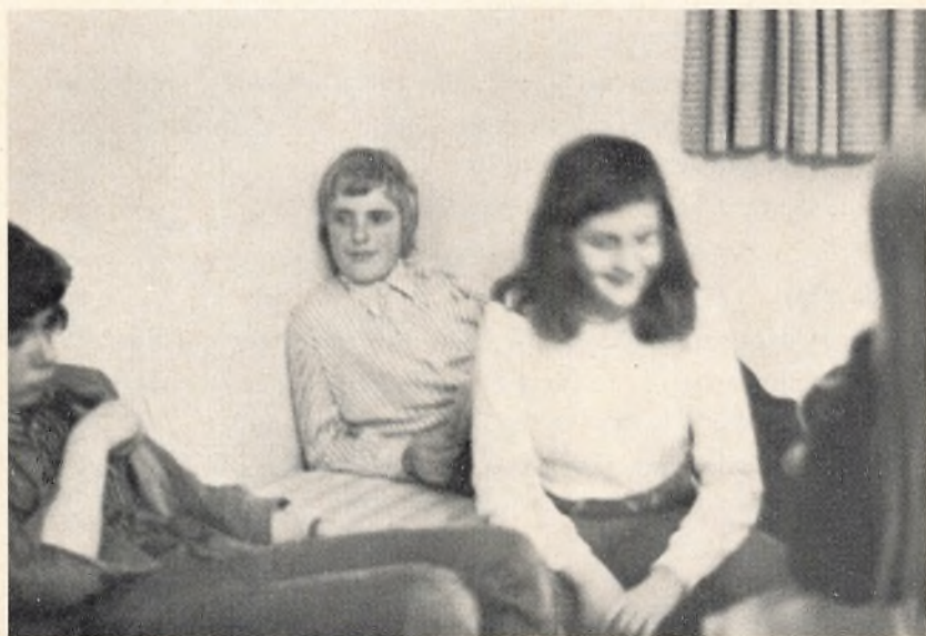
— og så slappes der af