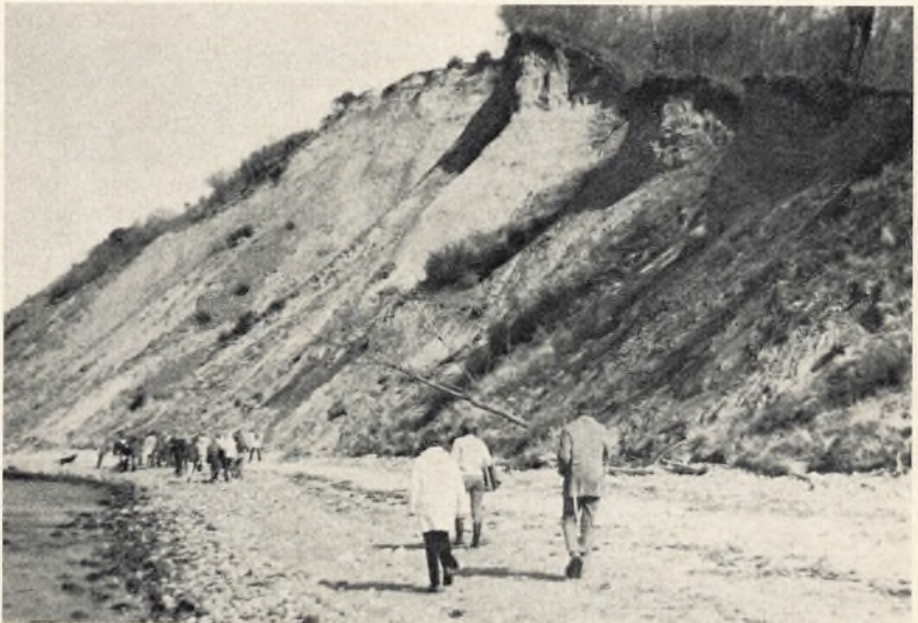
— og studeres