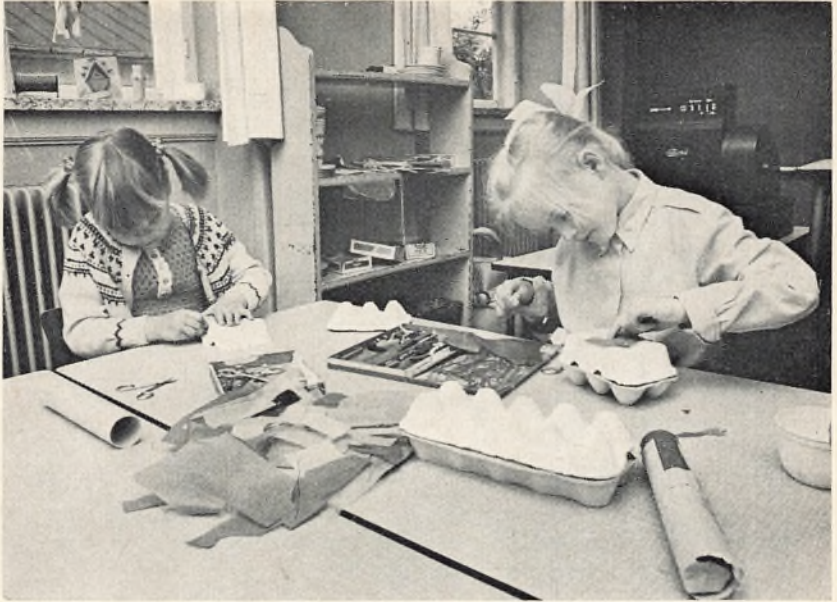
Børnehaveklassen i arbejde