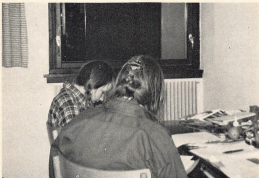
dagens rapport udarbejdes —