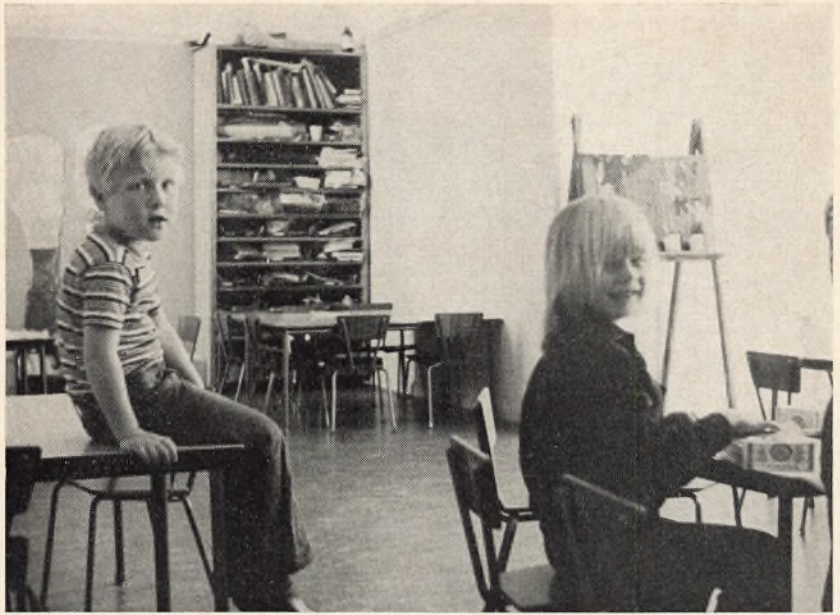
Børnehaveklassen i arbejde