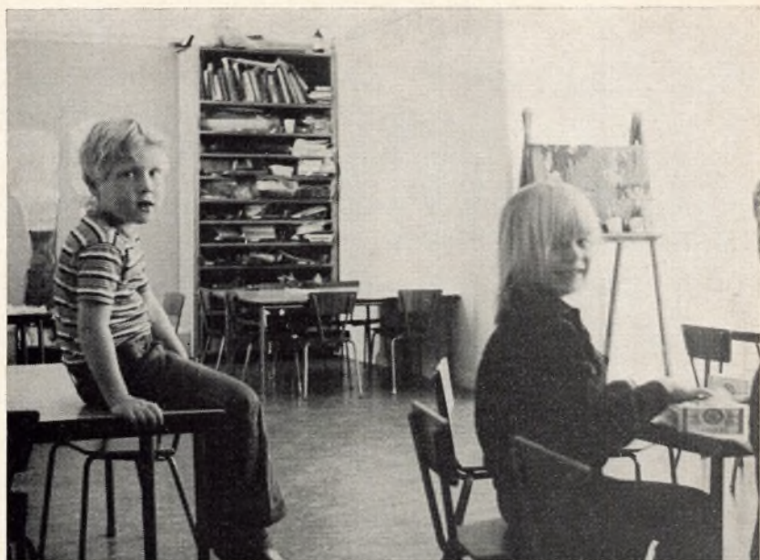
Børnehaveklassen i arbejde