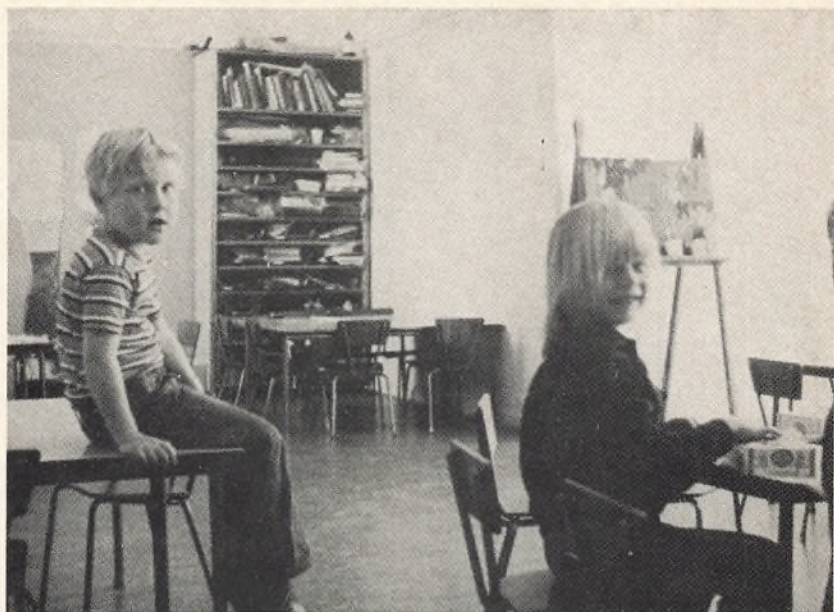
Børnehaveklassen i arbejde