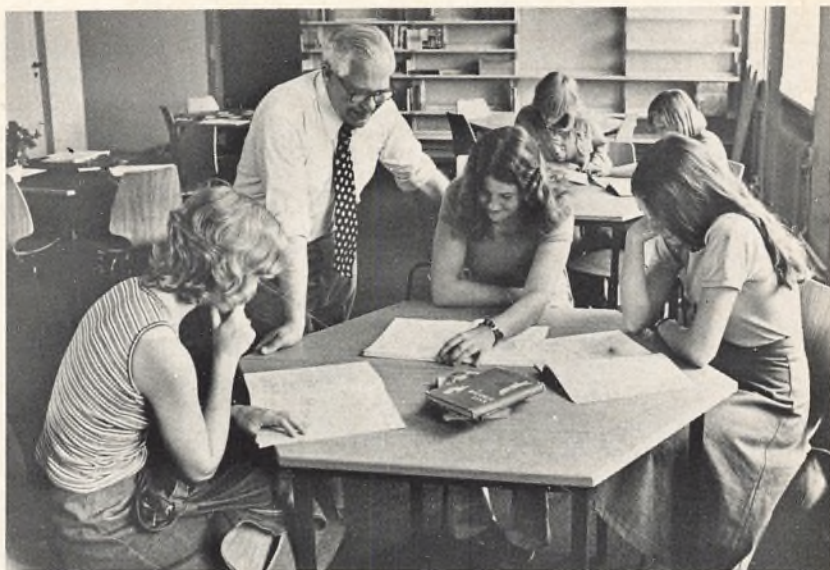
Fra de nye lokaler på 3. sal.