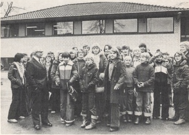
Elever foran nybygningen