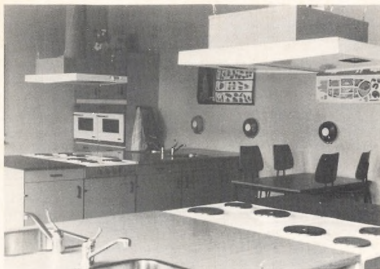
Skolekøkken indrettet 1977