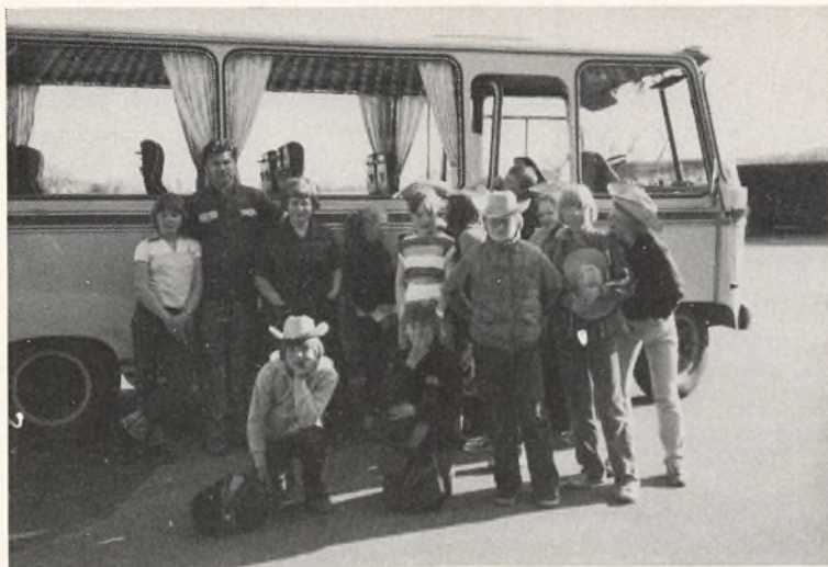
5. klasse på lejrskole.