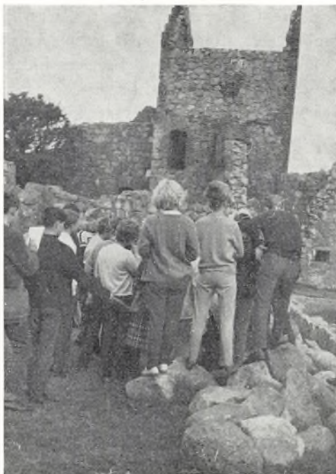
Der arbejdes i ruinerne på »Hammershus«

Et led i skolens arbejde, der forlængst har bevist sin værdi, er lejrskolen. I en årrække var denne særlige arbejdsform anvendt over for elever i det 7. skoleår, nu er den flyttet til det