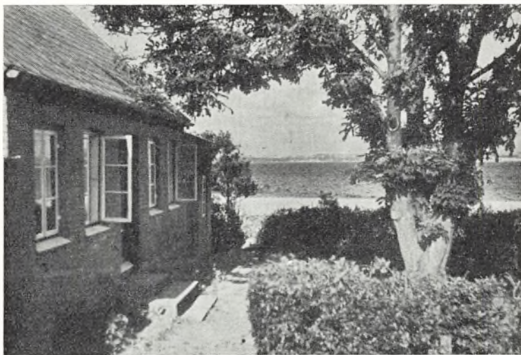
Weekend-hytten ved Helnæsstrand.