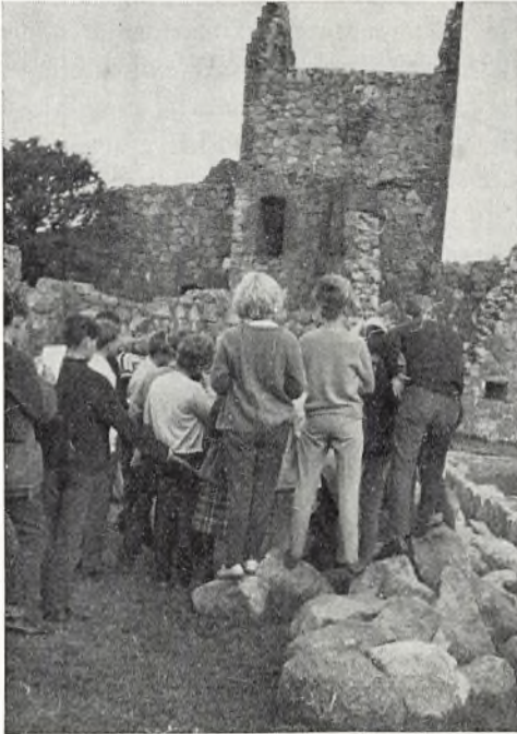
Der arbejdes i ruinerne på »Hammershus«

Et led i skolens arbejde, der forlængst har bevist sin værdi, er lejrskolen. I en årrække var denne særlige arbejdsform anvendt over for elever i det 7. skoleår, nu er den flyttet til det 8. skoleår i erkendelsen af, at større modenhed giver større mulighed for selvstændigt arbejde. Tidligere har lejrskolen været afholdt på godset »Skovsbo« og i grænselandet, for tiden er den på Bornholm. Formålet er at lade eleverne selv indsamle det materiale, deres viden skal bygge på, i stedet for kun at