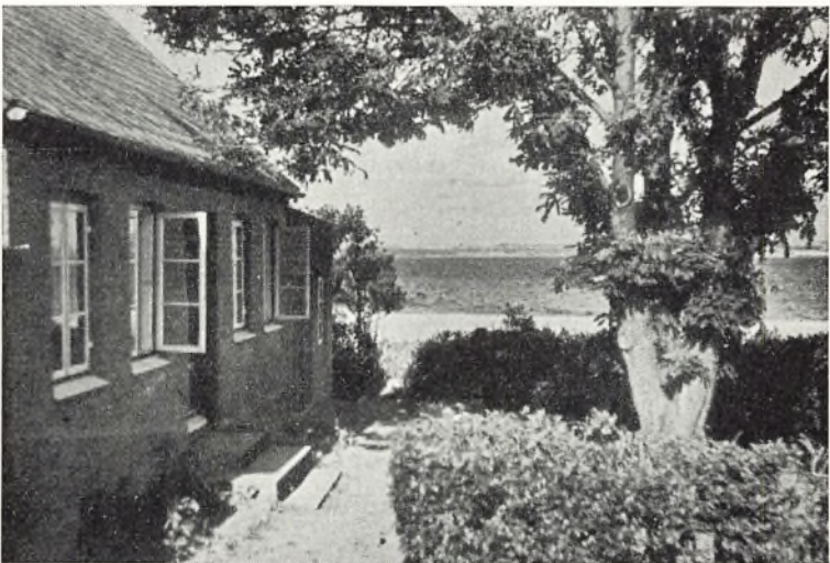
Weekend-hytten ved Helnæsstrand