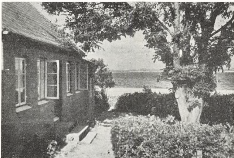
Weekend-hytten ved Helnæs strand