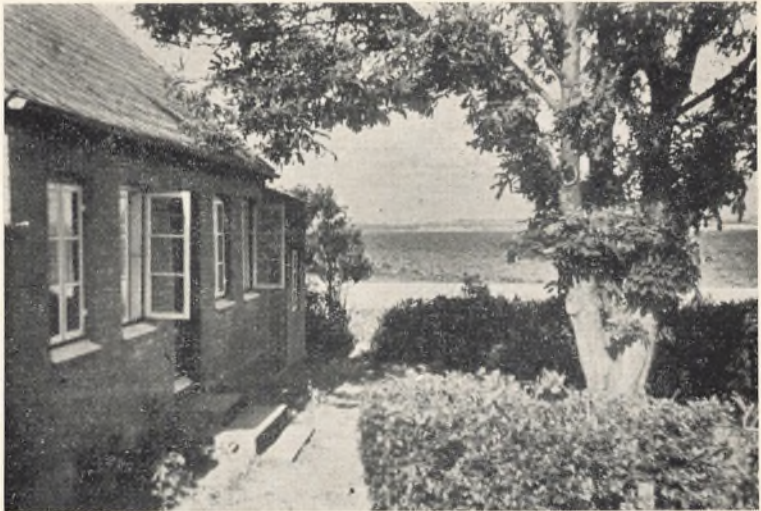
Weekend-hytten ved Helnæs strand