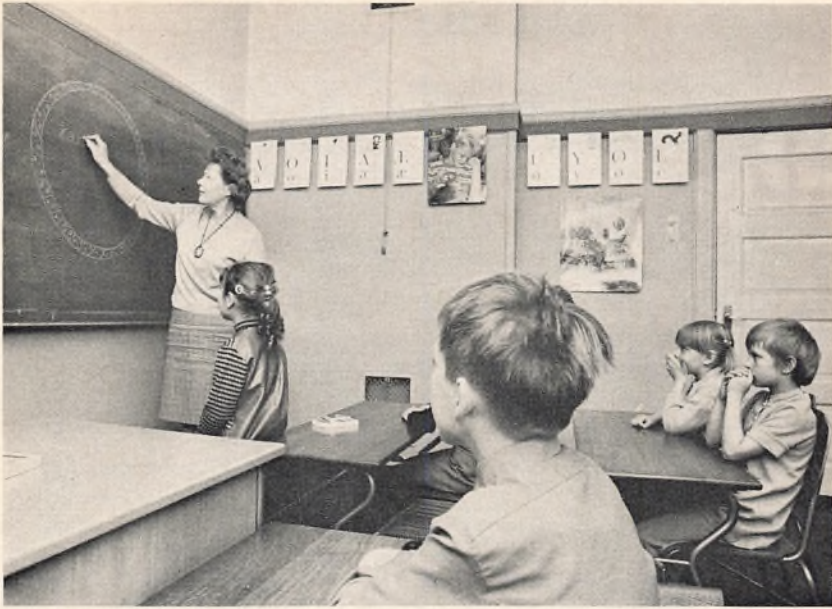
Fødselsdag i 1. klasse