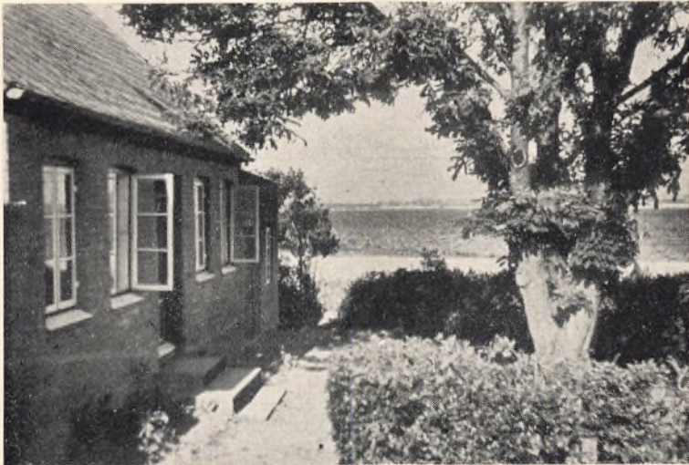
Weekend-hytten ved Helnæs strand