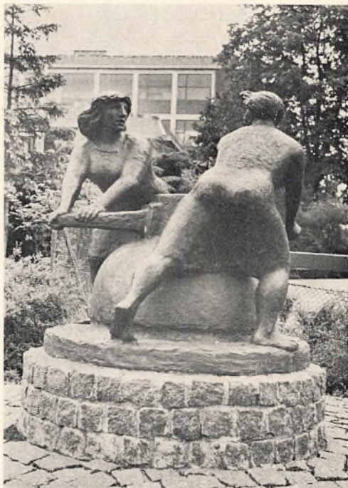
Fenja og Menja

Skemaer kan fås på skolen efter sommerferien.