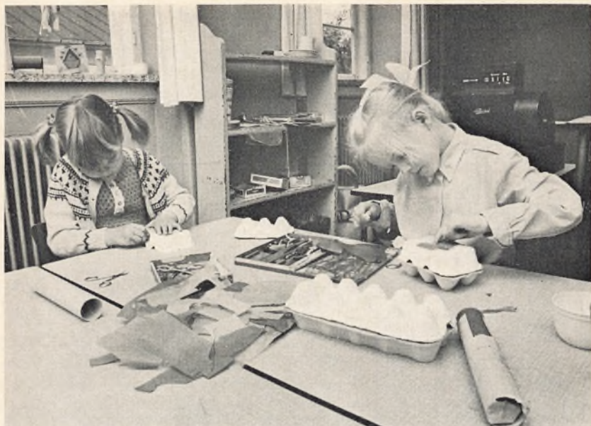
Børnehaveklassen i arbejde